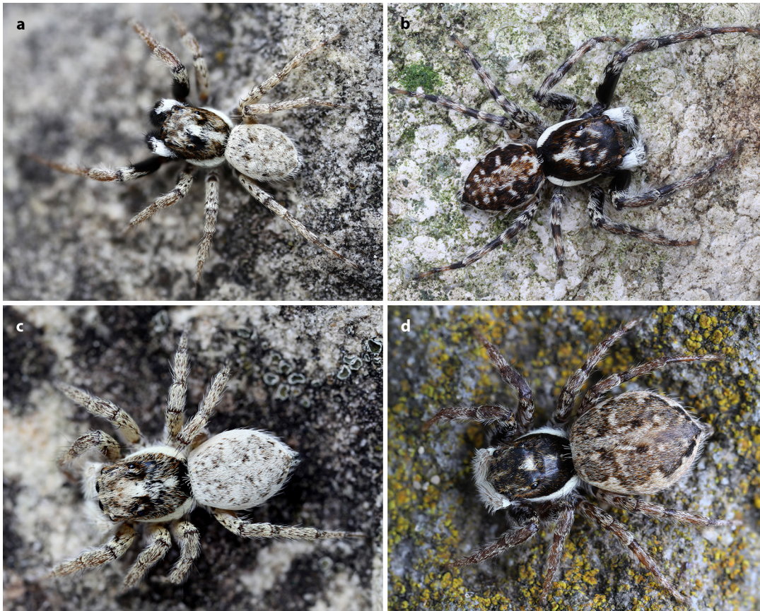
Abb. 2/ Fig. 2: Menemerus semilimbatus ,

a. Männchen von Kos, Dorsalansicht; b. Männchen aus Portugal, Dorsalansicht;