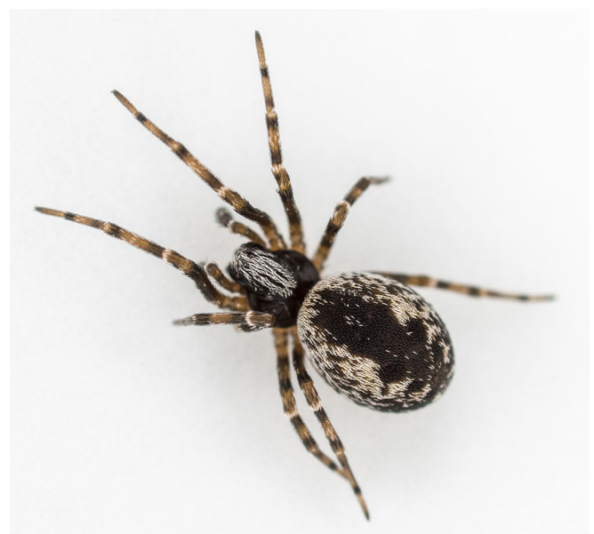
Abb. 1: Weibchen von Brigittea civica (Lucas, 1850), Habitus Fig. 1: Female of Brigittea civica (Lucas, 1850), habitus

Material und Methoden. Bayern, Bamberg-Nord, Zollnerstraße, Gewerbegebiet (ehemalige Kaserne), 49,90681°N, 10,91546°E, 250 m, TK-6031, 21. Mai 2018: 1 ♂, 2 ♀; Hirschaid, Ortsmitte, öffentliches Gebäude, 49,81644°N, 10,98991°E, 251 m, TK-6131, 10. Jun. 2018: 1 ♂, 1 ♀; Forchheim/Ofra, Nähe Nürnberger Tor, Wohngebäude, 49,71571°N, 11,06169°E, 264 m, TK-6232, 10. Jun. 2018: 1 ♂, 1 ♀; Baiersdorf, Ortsmitte, Wohngebäude, 49,65677°N, 11,03279°E, 272 m, TK-6332, 10. Jun. 2018: 1 ♂, 1 ♀; Erlangen, Universitätsstraße, Wohngebäude, 49,59700°N, 11,00768°E, 284 m,