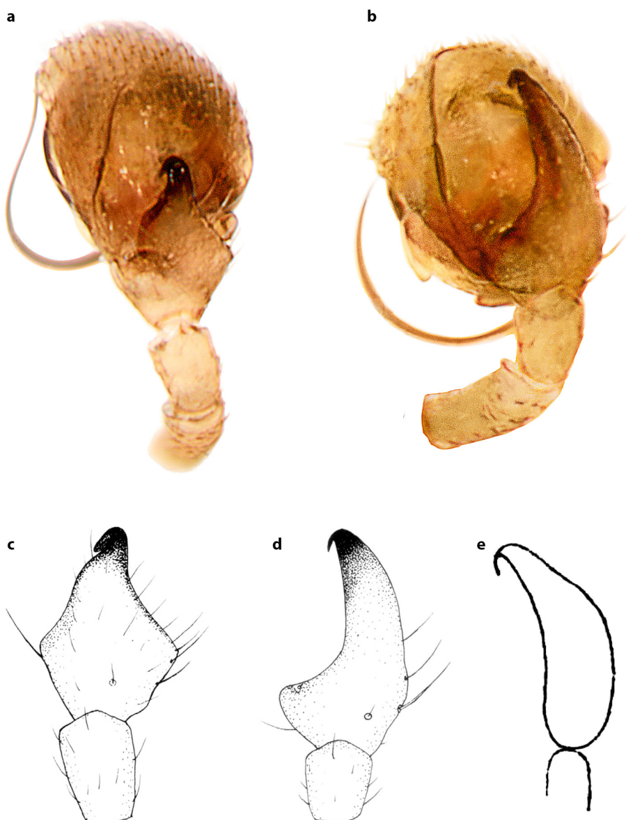
Abb. 1: Tibia-Apophyse von Silometopus , Ansicht dorsal. a. S. incurvatus aus Mecklenburg-Vorpommern; b. S. acutus aus Brandenburg; c. S. incurvatus , Abbildung aus Holm (1977); d. S. acutus , Abbildung aus Holm (1977); e. Tapinocyba bilacunata , Abbildung aus Koch (1881) (gedreht) Fig. 1: Tibial apophysis of Silometopus , dorsal view. a. S. incurvatus from Mecklenburg-Vorpommern; b. S. acutus from Brandenburg; c. S. incurvatus , illustration from Holm (1977); d. S. acutus , illustration from Holm (1977); e. Tapinocyba bilacunata , illustration from (Koch) 1881 (rotated)

leg. U. Rexin, coll. K.-H. Kielhorn; Brandenburg, Kerkwitz, Torfteich, Zwischenmoor, 51.91098°N, 14.61177°E, 65 m ü. NHN, 4. Mai 2022, 1 ♂, leg. U. Rexin, Bodenfalle, coll. K.-H. Kielhorn; Brandenburg, Holbeck, ehemaliger Truppenübungsplatz, flechtenreicher Trockenrasen, 52.03424°N, 13.28061°E, 61 m ü. NHN, 31. Okt. 2021, 1 ♂, Streugesiebe, leg. et coll. K.-H. Kielhorn; Niedersachsen, Lüchow-Dannenberg, NSG Nemitzer Heide, Genisto-Callunetum, 52.98333°N, 11.33333°E, 25 m ü. NHN, 1. Mai 1996, 1 ♂, Bodenfalle, leg. et coll. S. Merckens; Sachsen, Zwickau, Langteichkippe bei Berzdorf, Abraumhalde, 51.06696°N, 14.93076°E, 236 m ü. NHN, 6. Apr. 1962, 1 ♂, leg. W. Dunger, coll. MfN 13793; Sachsen-Anhalt, Dessau-Roßlau, Streetz, Kiefern-Stangenholz (ca. 20jährig), 51.93727°N, 12.2046°E, 102 m ü. NHN, 4 ♂♂, 5. Apr. 2005, leg. LAU Sachsen-Anhalt, coll. K.-H. Kielhorn; Sachsen-Anhalt, Seeben, Seebenauer Holz, Erlenbruch, 52.89489°N, 11.02844°E, 31 m ü. NHN, 3. Mai 2022, 1 ♂, leg. LAU Sachsen-Anhalt, coll. K.-H. Kielhorn, Sachsen-Anhalt, Wiewohl, Kiefernforst mit Blaubeere, 52.84034°N, 10.80653°E, 92 m ü. NHN, 30. Mrz. 2022, 13 ♂♂, 3. Mai 2022, 1 ♂, leg. LAU Sachsen-Anhalt, coll. K.-H. Kielhorn.