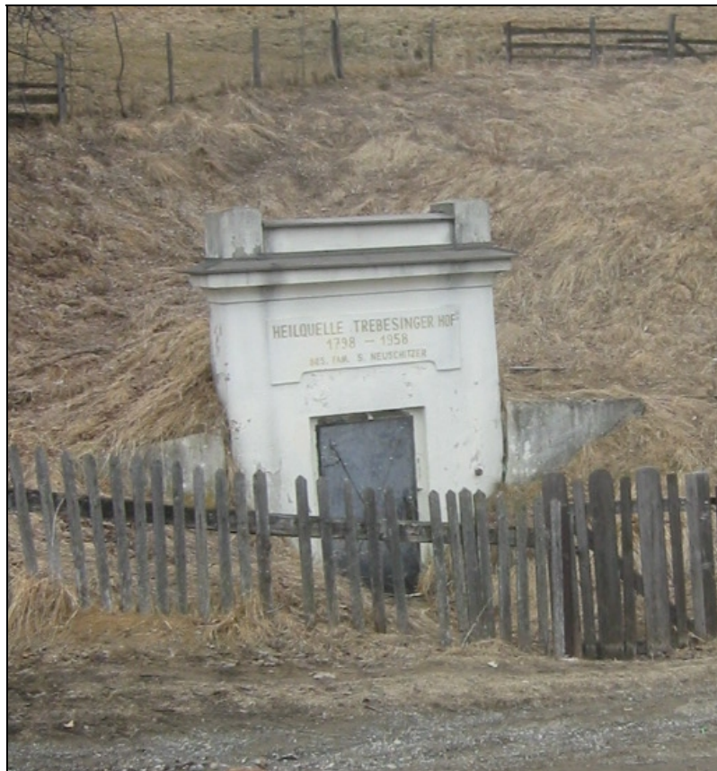
Abb. 1: Quellstube des Säuerlings von Trebesing in der Ortschaft Zlatting am Südostabfall des Sparberkopfes