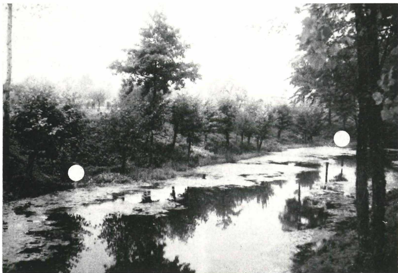
Fig. 1. La zone de tête du fontanile Cascina Emilia: les points blancs indiquent les sources.

Sadleriana fluminensis est indiquée comme espèce demeurant dans l'Europe sud-orientale; ALZONA & ALZONA BISACCHI (1939) l'indiquent pour la Lombardie, Vénétie tridentine et Vénétie. Les exemplaires que j'ai recueillis corre-