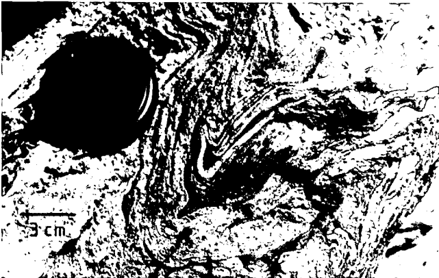
Abb. 3: Alpidische Faltenstrukturen an einem varistisch gebildeten Quarzgang der Norischen Decke einige 10er m über der Norischen Überschiebungsfäche; laminierte Metatuffite der Schichten unter dem Blasseneckporphyroid.

Quarzgang (hell-Mitte, s_0 ) wird alpidisch isoklinal gefaltet ( B_1 ) und durch enge D_2 -Falten wiedergefaltet. Beachte den Falten-schluß links unten, dieser ist typisch für Biegegleitfalten, für „chevron“-Falten, vgl. RAMSAY (1974, p. 1774, Fig. 13 [„hinge collapse“]). Das extrem gut ausgebildete ss, s_1 -Lagengefüge ermöglicht ein Gleiten im Lagenbau, das Abwandern inkompetenten Materials (z. B. Graphit) in die Falten Scheitel.