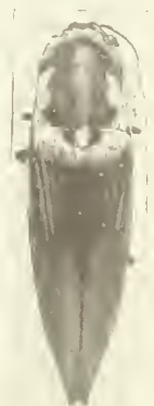
S. imperialis var. Schenklingi nov.

Angustus, nitidus, glaber; capite rufo-sanguineo, fronte bispinosa, medio excavata. Prothorace rufo-sanguineo, longo, sparsim punctato, disco convexo, lateribus distincte marginatis, elevatis, parallelis, apicem versus leviter rotundatis; angulis anticis productis, posticis dilalatis, paulo divergentibus; scutello rufo-sanguineo, nigro-cincto, antice emarginato. Elytris elongatis, prothorace paulo latioribus, subtilissime punctato striatis, rufo-sanguineis, apicem versus croceis, vittis duabus nigris, abbreviatis; fossula scutellari rufo-sanguinea; ventre luteo, utrinque nigro-vittato. Pedibus rufis.