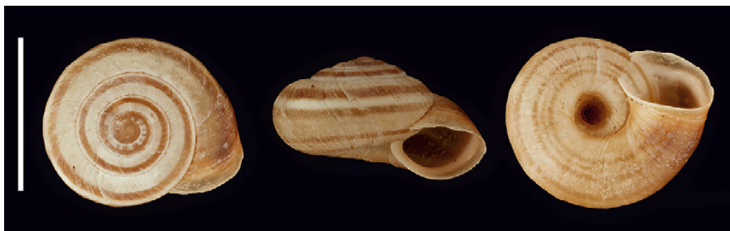
Abb. 3: Helicella itala aus St. Michael im Lungau. Maßstab: 1 cm.

gänglich ( https://observation.org/bioblitz/npht-tage-der-artenvielfalt-2021/ ). Eine Karte der Fundorte im Oberen Murtal wurde in R Studio (RStudio Team 2021) mit dem R-Packet leaflet (Cheng et al. 2021) mit der Kartengrundlage von OpenStreetMap und den Bundesländergrenzen (Bundesamt für Eich- und Vermessungswesen 2017) erstellt und manuell ergänzt.