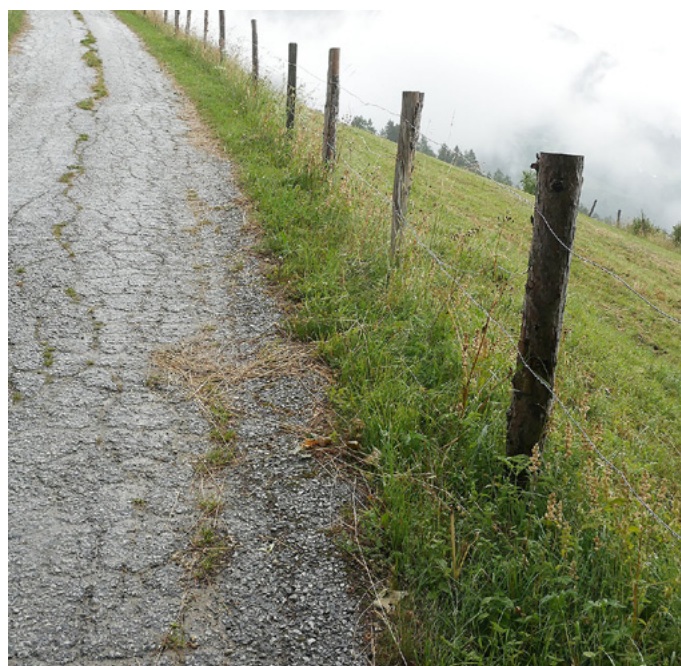
Abb. 2: Fundort von Helicella itala im nördlichen St. Michael im Lungau (Sonderstandort).

Die Begehungen für die Artenliste der Mollusken erfolgten von 16. bis 20. Juli 2021. Zwei der vier Aufnahmebereiche in der Kernzone des Nationalparks sowie die zusätzlichen Bereiche 5 bis 7 wurden begangen. Jeder Fund wurde nach Möglichkeit fotografisch dokumentiert und mit der Angabe des Fundortes in die Naturbeobachtungsplattform Observation.org eingegeben (vgl. Kwitt 2021). Nacktschnecken (Arionidae, Limacidae) wurden zur Artbestimmung konserviert und seziiert. Glasschnecken (Vitrinidae) sowie ein Teil der Gehäuseschnecken und deren Leerschalen wurden als Belege aufgesammelt und unter dem Binokular nachbestimmt. Eine Artenliste für die Aufnahmebereiche findet sich in Tabelle 1. Die Beobachtungen mit den jeweiligen Standortdaten sind im Appendix 1 zusammengefasst. Weiters sind die Daten auf der Beobachtungsplattform Observation.org unter dem Bioblitz „NPHT Tage der Artenvielfalt 2021“ online zu-