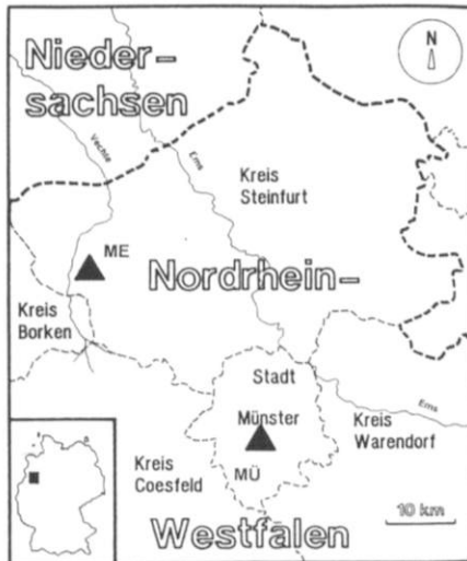
Abb. 1.: Lage der Untersuchungsflächen (ausgefüllte Dreiecke). Die Dreiecke stehen für zwei bzw. drei Untersuchungsflächen.

Die untersuchten Ackerbrachen liegen in der Westfälischen Bucht (Nordrhein-Westfalen) auf dem Gebiet der Stadt Münster und der Gemeinde Metelen (Krs. Steinfurt) (vgl. Abb. 1). Bei den beiden Münsteraner Brachen (MÜ7, MÜ8) handelt es sich um im Rahmen des Flächenstilllegungsprogrammes der Europäischen Union stillgelegte Ackerflächen, während die auf dem Außengelände des Biologischen Instituts gelegenen Metelener Brachen (ME2, ME6, ME7) ausschließlich Naturschutzzwecken dienen und längerfristig gesichert sind.