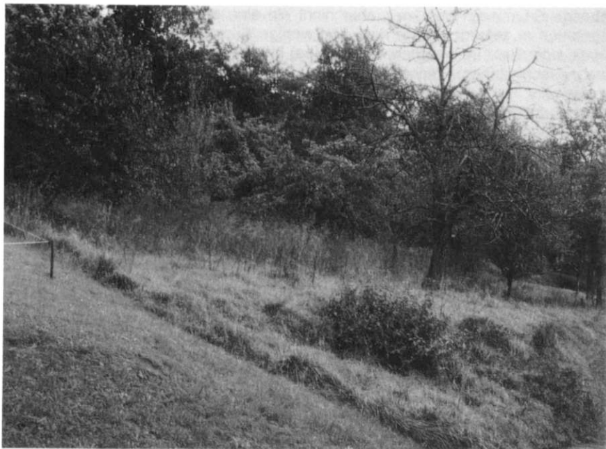
Abb.2.: Habitat der Gestreiften Zartschrecke in versäumten Streuobstwiesen