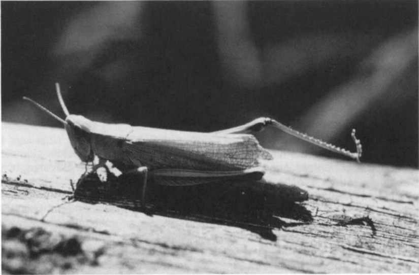
Abb. 1: Ein macroptereres Weibchen von Chrysochraon dispar . Macroptere Tiere sind sehr vagil und zur Ausbreitung über Land gut geeignet.