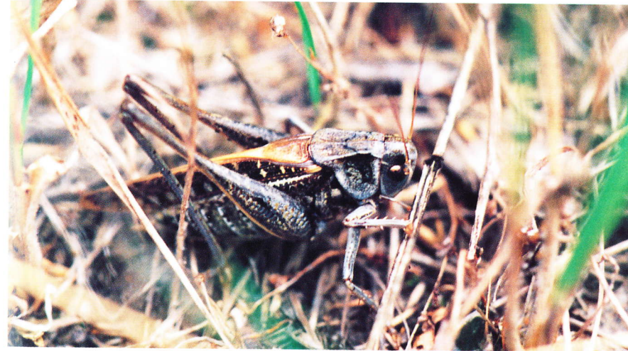
Abb. 2: Decticus verrucivorus (♂) nach Verlassen der Singwarte

sänge vernehmbar waren. Eine gezielte Nachsuche ergab ein für Südostbrandenburg typisches Verhalten der Männchen, innerhalb der gut strukturierten Vegetation (auch kopfüber) eine höhere Singwarte einzunehmen. So entgehen die Tiere der Dämpfung der Stridulationslaute durch die dichte Bodenvegetation (vgl. KEUPER et al. 1986, KALMRING et al. 1990, Abb. S. 114 - D. albifrons - in BELLMANN 1993). Auch für Tettigonia viridissima und andere Arten konnten im Untersuchungsgebiet derartige Beobachtungen gemacht werden. Damit stimmen die Beobachtungen eher mit denen von RÖBER (1970) überein als mit denen von KALTENBACH (1962), OSCHMANN (1969) und INGRISCH (1979; Diskussion s. dort). Bei Annäherung wurde der Gesang sofort eingestellt, die Tiere flohen in die unteren Vegetationsschichten (Abb. 2).