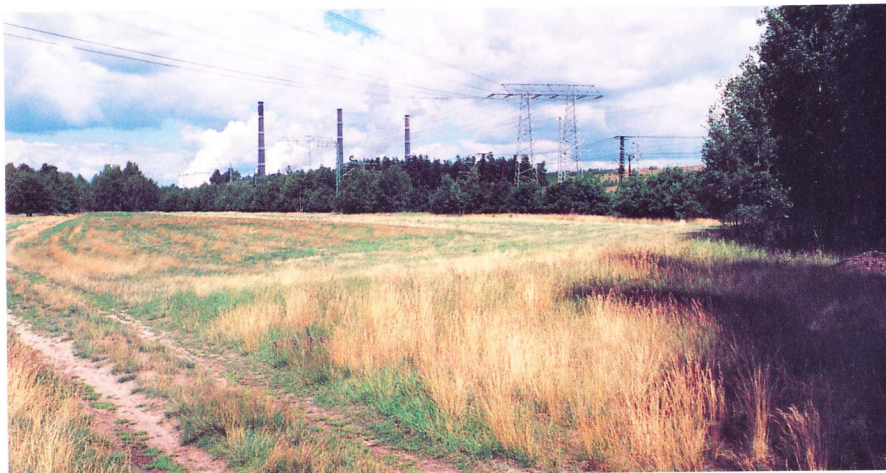
Abb. 1: Fundort vorn rechts, im Hintergrund Kraftwerk Jänschwalde, Blick nach Nordost

teilweise aufgeforstet worden. Die Aufforstungen ähneln noch stark den umliegenden Freiflächen, die als ruderale Hochstaudenfluren außerhalb von Ortschaften zu charakterisieren sind (ZIMMERMANN 1995). Westlich des Fundortes verlaufen mehrere 110-kV-Stromleitungen zwischen dem Kraftwerk Jänschwalde und dem Umspannwerk Neuendorf über weitere Ackerbrachen, die charakterlich eher Sandtrockenrasen gleichen.