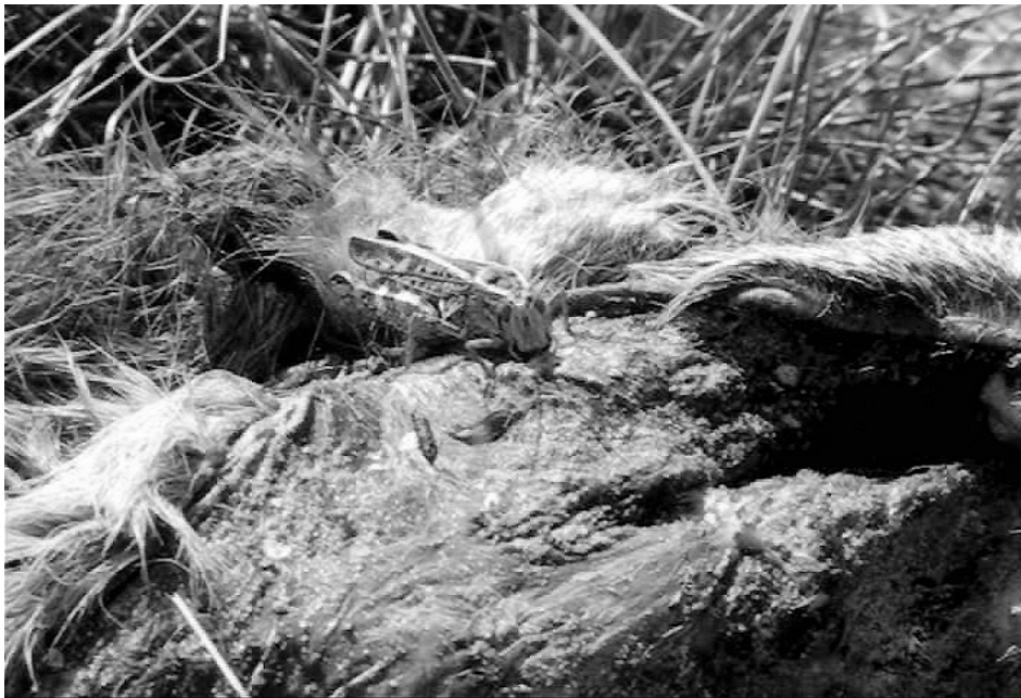
Abb. 1: Calliptamus italicus beim Fressen am Rehkadaver am 17.08.2009 (Bildausschnitt aus einem Video)

folgendem Link eingesehen werden: http://www.youtube.com/watch?v=XhrUgmj-IVI . Ebenfalls bei YouTube finden sich weitere Videos aus dem Necros-Projekt.