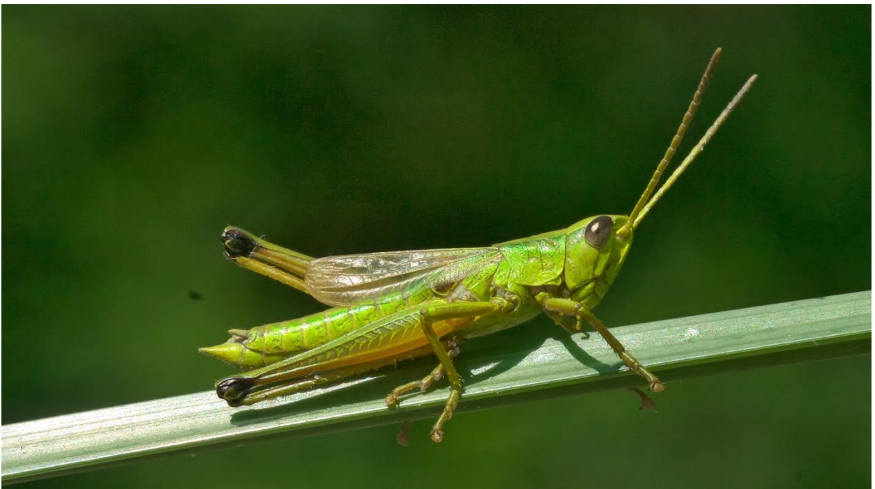
Abb. 3: Männchen der Große Goldschrecke Chrysochraon dispar (Germar, 1834).