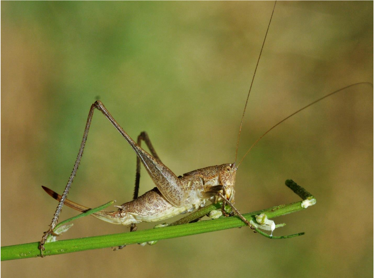
Abb. 2: Weibchen der Zierliche Strauschschrecke Rhacocleis germanica (Herrich-Schäffer, 1840).