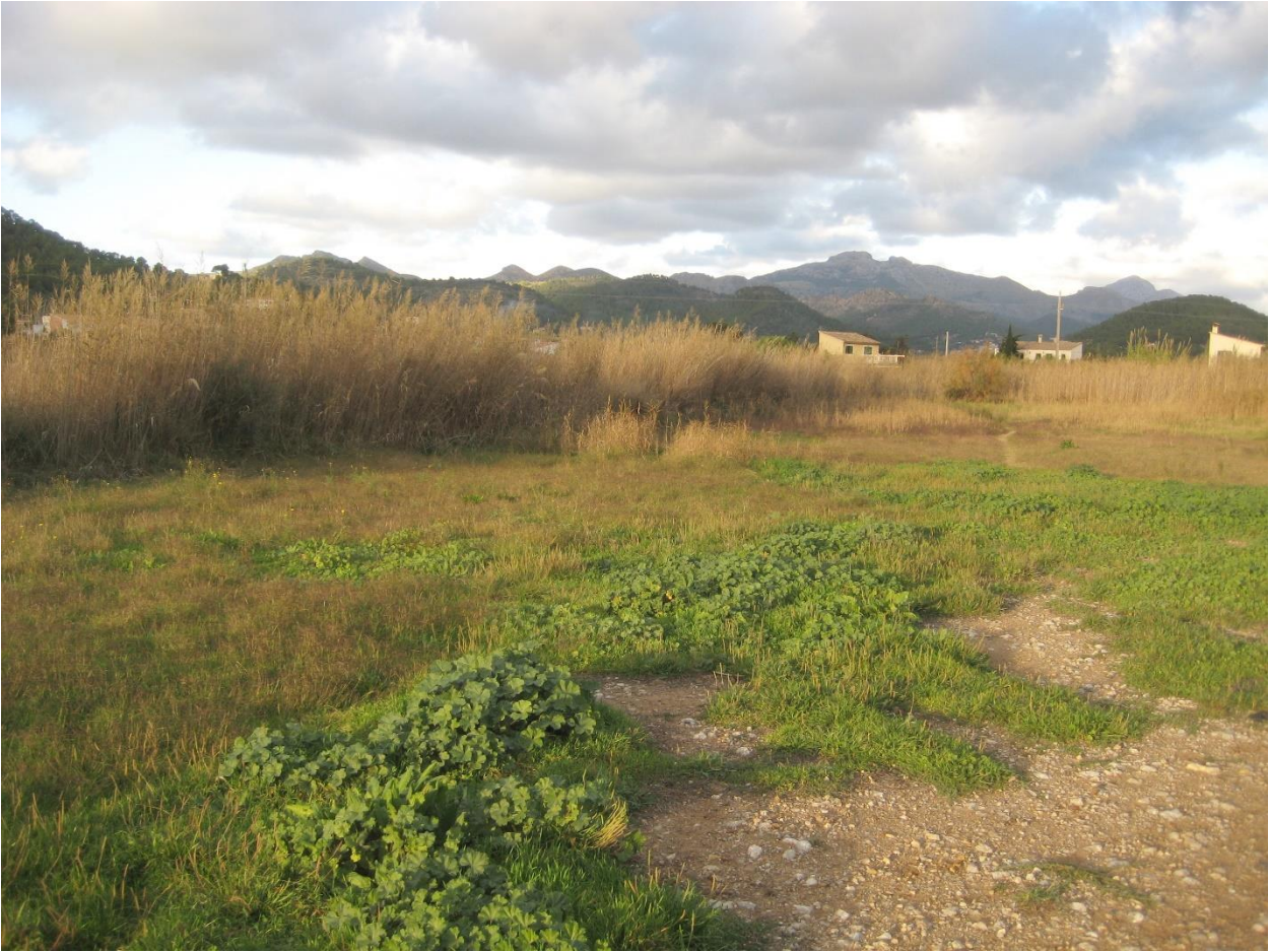
Abb. 2: Der Fundort in Port d' Andratx, Mallorca, 26.11.2017.