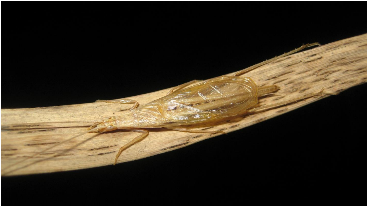
Abb. 1: Männchen von Oecanthus dulcisonans am Fundort in Port d' Andratx, Mallorca, Spanien, 21.11.2017.