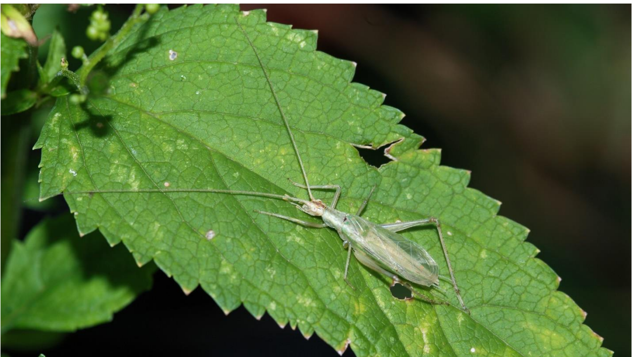
Abb. 3: Männchen von Oecanthus pellucens, Gablitz, Niederösterreich. 26.8.2018.