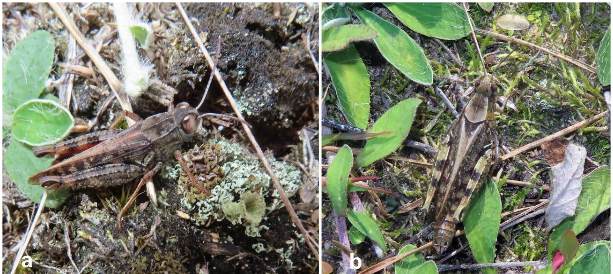
Abb. 3: Calliptamus italicus . a. Männchen (NSG Marienfließ), b. Weibchen (TÜP Jägerbrück).