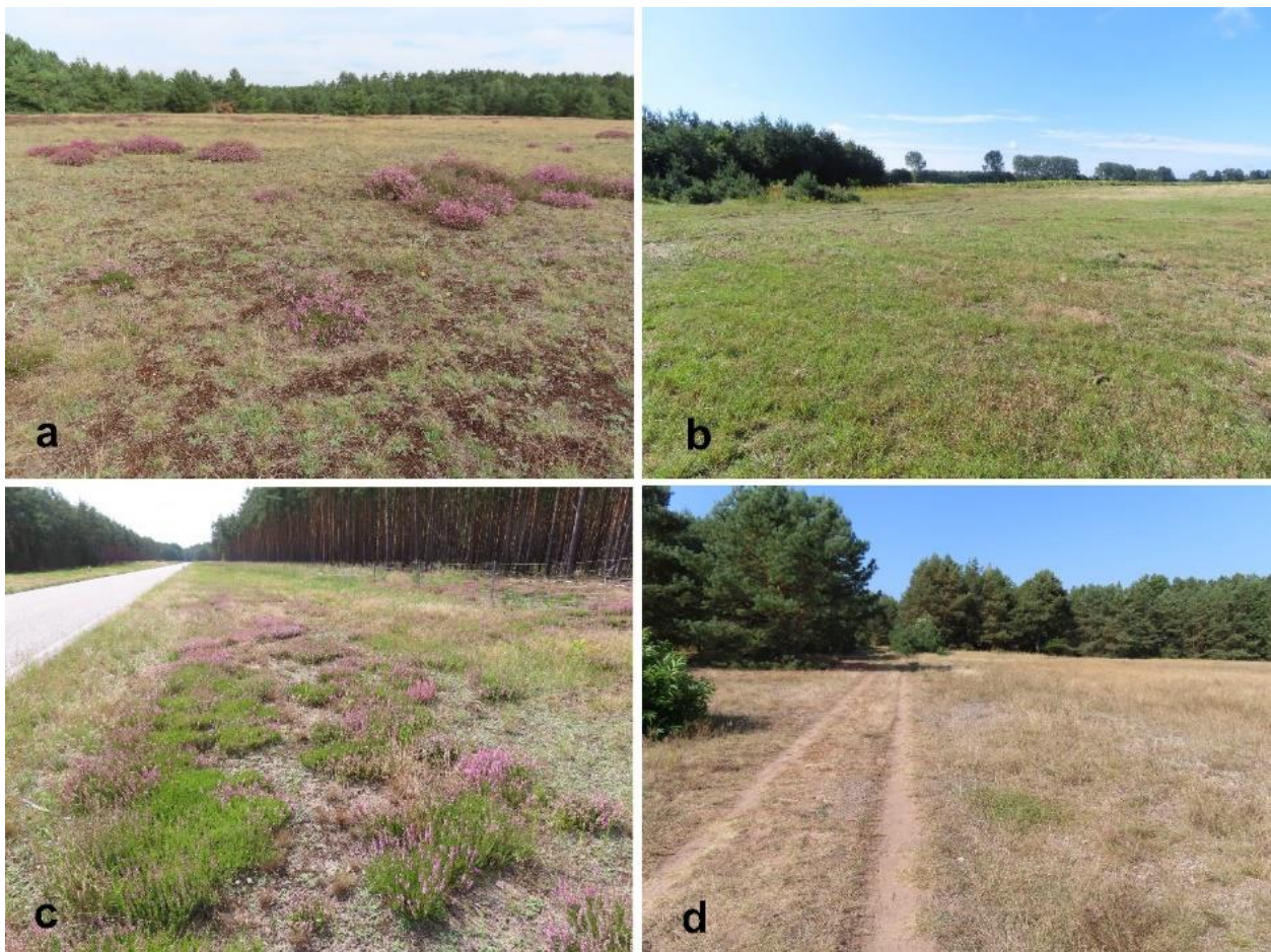
Abb.5: Fundorte der Italienischen Schönschrecke. Typisch ist ein Nebeneinander von offenen Bodenabschnitten und etwas dichter Vegetation. a. NSG Marienfließ b. Brache bei Mirow c. TÜP Jägerbrück Torgelow d. Granzin Müritz NP

Aufgrund der aktuellen Befunde kann noch keine gesicherte Aussage zum Status der Art in MV abgeleitet werden, d.h. wie weit es sich bei den Funden von z.T. nur wenigen Exemplaren lediglich um migrierende Tiere oder bereits ortstreue lokale Fortpflanzungsgemeinschaften handelt. Larvenstadien wurden bisher noch nicht gefunden. Es sind weitere Untersuchungen notwendig, um Verbreitung, regionale Habitatpräferenz sowie Bestandssituation genauer einzuschätzen. Deshalb wären auch zukünftig alle Hinweise auf Beobachtungen von Tieren mit roten Hinterflügeln interessant, wobei für eine Überprüfung und Einordnung des Fundes aber möglichst eine Fotodokumentation erstellt werden sollte.