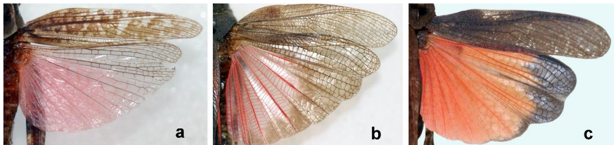
Abb. 1: Rotflügelige Kurzfühlerschrecken Checkliste MV. a. Italienische Schönschrecke Calliptamus italicus , Hinterflügel (Hfl) nur im basalen Teil rosa- bis orangerot, ohne dunkle Binde b. Gefleckte Schnarrschrecke Bryodemella tuberculata , Hfl rot, am Hinterrand mit brauner Querbinde c. Rotflügelige Schnarrschrecke Psophus stridulus Hfl kräftiger rot, am Hinterrand mit dunkler Querbinde.

Um die Verbreitung der Art im Bundesland besser einschätzen zu können, wurden im Jahr 2024 die bisher bekannten Standorte erneut kontrolliert und gezielte Begehungen auf geeignet erscheinenden Flächen (ehemalige und noch aktuell genutzte Truppenübungsplätze, Binnendünen, Müritz Nationalpark und einige NSG) durchgeführt. Im Ergebnis dieser Kartierungen konnte Calliptamus italicus auf den bisherigen Standorten erneut belegt und auf 9 weiteren Flächen nachgewiesen werden (Tabelle 1). Zusätzliche Beobachtungen ergaben sich über eine Anfrage bei der Abteilung Biodiversität und Landschaftsökologie der Universität Osnabrück sowie Recherchen im Internet (Observation.org, iNaturalist). Eine Übersicht zu den derzeit bekannten Fundpunkten gibt Abb. 2.