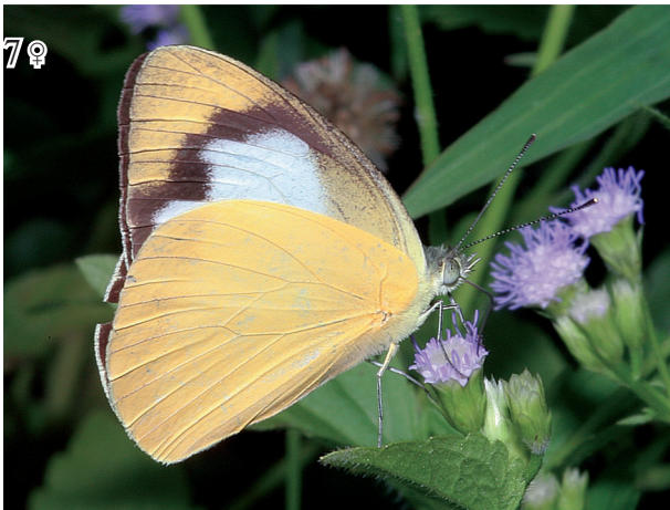
Abb. 4-7: Appias albina albina (BOISDUVAL, 1836). Abb. 8: Appias nero figulina (BUTLER, 1867).