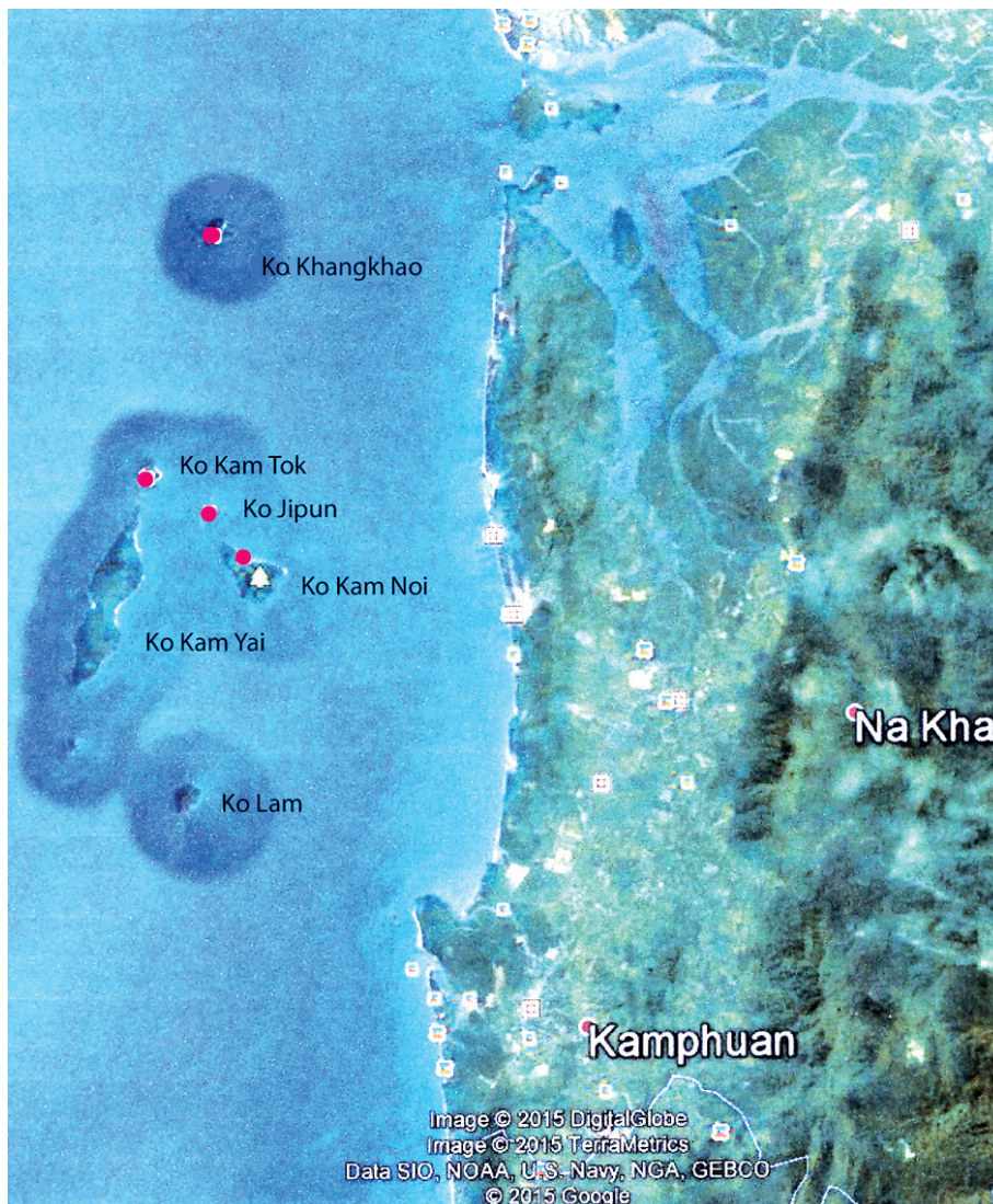
Abb. 2: Die Kam Inseln, sofern man Ko Khangkhao und Ko Lam dazu rechnet, bestehen aus insgesamt 9 Inseln und Inselchen (drei davon zu Ko Jipun gehörig), die zwischen 9^{\circ} 34' 09.51'' N, 98^{\circ} 23' 18.28'' O und 9^{\circ} 26' 10.63'' N, 98^{\circ} 21' 05.18'' O in der Andamanensee liegen. Die höchste Erhebung befindet sich auf Ko Kam Yai mit ca. 290 m Höhe. Ko Khangkhao erreicht eine Höhe von ca. 116 m. Während die Südspitze von Ko Kam Tok nur eine Höhe von 16 m aufweist, erhebt sich die Nordspitze auf 76 m. Zwischen diesen Spitzen erstreckt sich die mondsichelförmige Ao (Bucht) Khao Kwai. Die Wanderung fand zwischen diesen beiden Inselspitzen statt, d.h. die Wanderung verlief von Südwest nach Nordost. Die roten Punkte markieren die Inseln, die ich in diesem Gebiet besuchte.