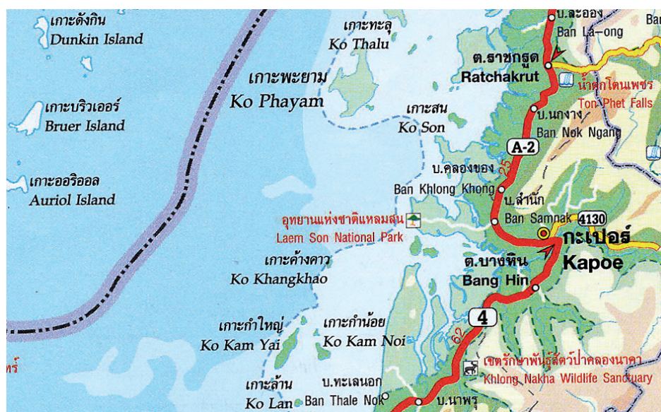
Abb. 1: Die Kam Inseln liegen etwa 10 bis 12 km Luftlinie vom Festland entfernt. Politisch gehören sie zu Thailand. Geographisch kann man sie gerade noch als die südlichsten Anteile des Mergui Archipels betrachten.

E-mail: drp.kueppers@web.de, p.kueppers@yahoo.de