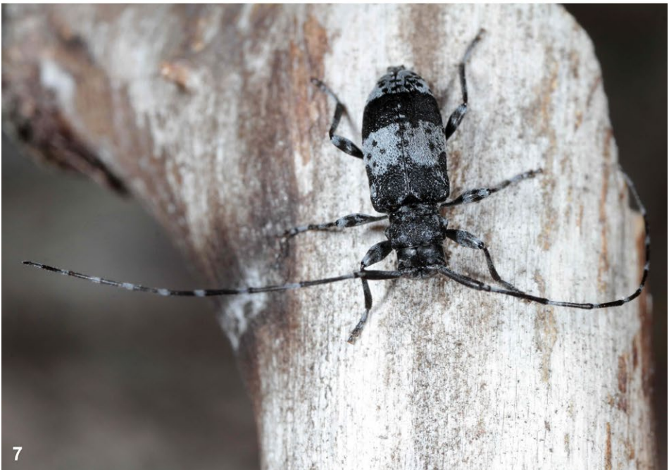
Abb. 6–7: (6) Bäckerbock ( Monochamus galloprovincialis pistor ). (7) Gepunkteter Splintbock ( Leioptus punctulatus ).