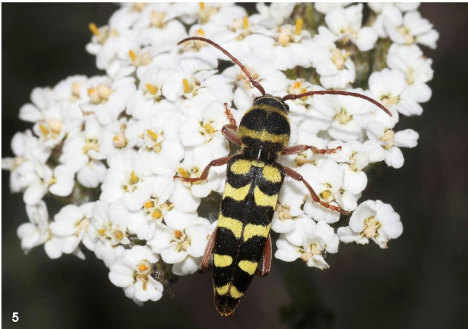
Abb. 4–5: (4) Alpenbock ( Rosalia alpina ); (5) Luzernenbock ( Plagionotus floralis ). ©Heinz Wiesbauer.