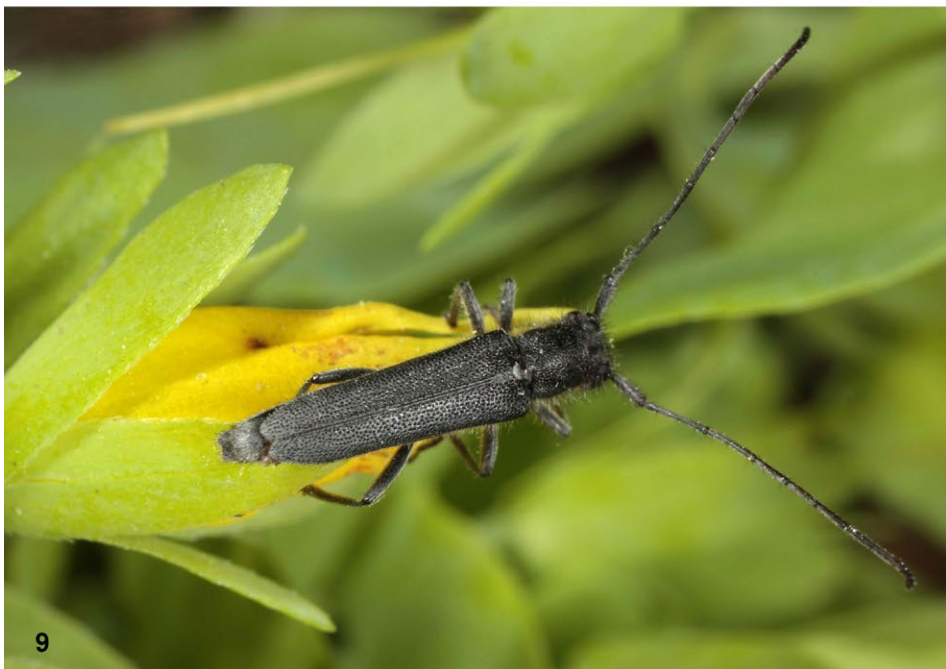
Abb. 8–9: (8) Ulmen-Wimpernböckchen ( Exocentrus punctipennis ); (9) Wachsbloemenböckchen ( Opsilia uncinata ).