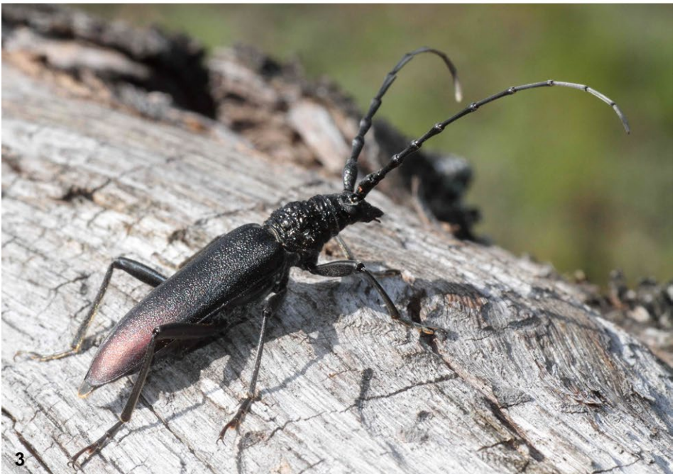
Abb. 2–3: (2) Breitschulterbock ( Akimerus schaefferi ); (3) Heldbock ( Cerambyx cerdo ).