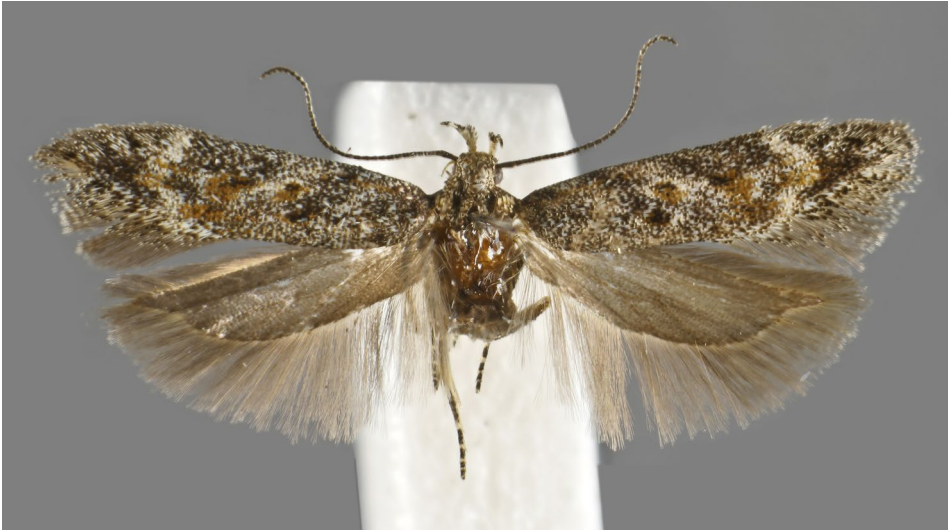
Abb.1: Scrobipalpa reiprichi .