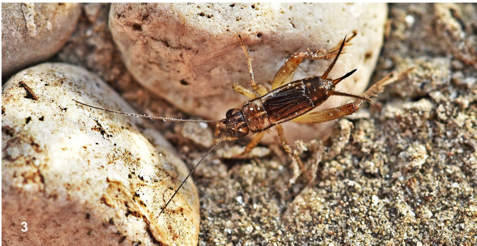
Abb. 2–3: Pteronemobius lineolatus : (2) Habitat in einem Abbaugelände bei Sankt Valentin, 27.9.2019, (3) Weibchen. / Pteronemobius lineolatus : (2) habitat in a gravel pit near Sankt Valentin, 27.9.2019, (3) female.