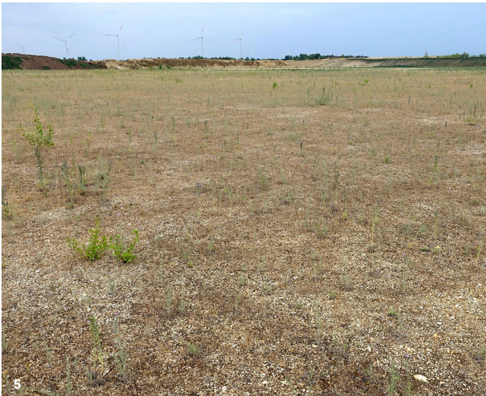
Abb. 4–5: Markgrafneusiedler Fläche 4 (4) Männchen, (5) 11.7.2021. / Site 4 near Markgrafneusiedl (4) male, (5) 11.7.2021.