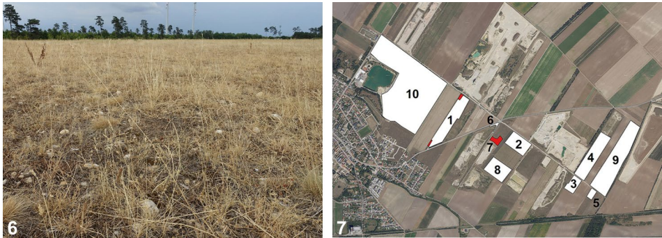
Abb. 6–7: (6) Extensive Rinderweide auf der Markgrafneusiedler Fläche 2 (11.7.2021). (7) Untersuchte Flächen im Schottergrubenkomplex Untersiebenbrunn mit (rot) und ohne (weiß) Nachweis von Docioptaurus brevicollis. / (6) Extensive cattle pasture at site 2 near Markgrafneusiedl (11.7.2021). (7) Examined sites in the gravel pit complex Untersiebenbrunn with (red) and without (white) records of Docioptaurus brevicollis.