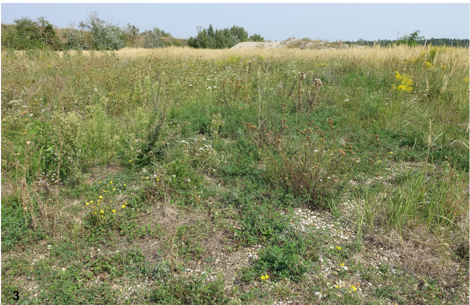
Abb. 2–3: Markgrafneusiedler Fläche 1 (2) Weibchen am ersten entdeckten Fundort auf Fläche 1, (3) 24.8.2019. / Markgrafneusiedl, site 1 (2) Female from the first discovered locality on site 1, (3) 24.8.2019.

Auf den anderen bei dieser Kartierung erhobenen Flächen gelangen keine Nachweise von D. brevicollis . Eine gezielte Suche am 18. Juli 2021 ergab jedoch einen weiteren Fundort an einem sehr flachgründigen Schotterstandort (Fläche 7, Abb. 7), an dem die Individuendichte mit zwei registrierten Exemplaren nur gering war.