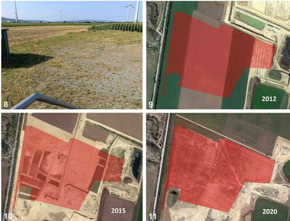
Abb. 8–11: (8) Habitat von Dociostaurus brevicollis auf der Kranstellfläche einer WEA bei Kittsee. (9–11) Entwicklung der Markgrafneusiedler Fläche 4 von 2012 bis 2020. / (8) Habitat of Dociostaurus brevicollis at a crane hardstand near Kittsee. (9–11) Development of site 4 near Markgrafneusiedl from 2012 to 2020. © (8) A. Panrok, (8–11) Kartengrundlage: Google Earth, Image Landsat/Copernicus.

kargen und nur mit schütterer Vegetation bedeckten Kranstellflächen direkt um die WEA (Abb. 9). Angrenzende Ackerflächen mit Offenböden wurden nicht besiedelt.