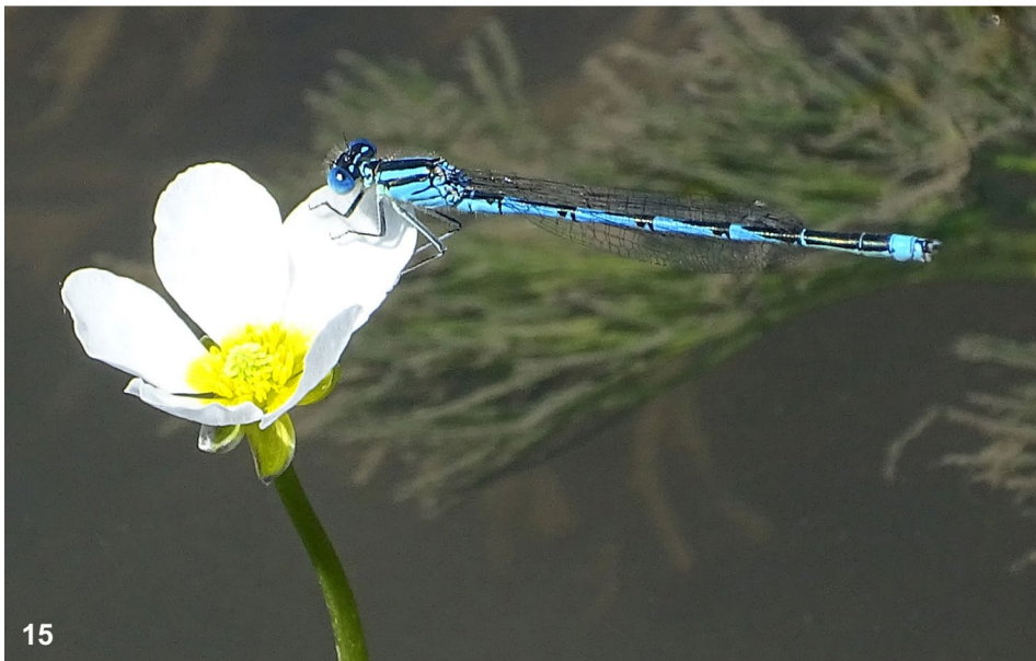
Abb. 14–15: (14) Männchen von Ophiogomphus cecilia an der Aschach, 13.7.2022. (15) Männliche Erythromma lindenii am Leitenbach, 11.6.2022. / (14) Male O. cecilia at the Aschach, (15) male E. lindenii at the Leitenbach.