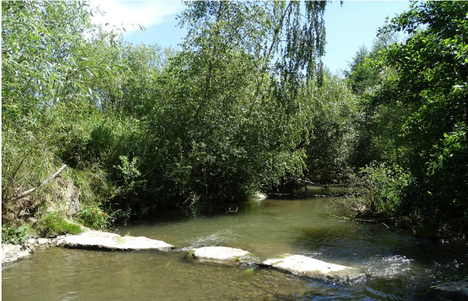
Abb. 4: Aufgelöste Sohlrampe im Leitenbach mit höherer Strömungsgeschwindigkeit, 14.7.2022. / Fish-passable rock-ramp in the Leitenbach with higher flow velocity.