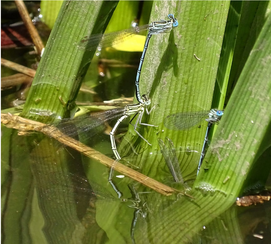
Abb. 18: Eiablagen von Platynemis pennipes am Sandbach. Das rechte Weibchen ist fast vollständig untergetaucht, 11.6.2022. / Egg deposition of P. pennipes at the Sandbach with one female almost completely under water.

Individuenzahlen von Platynemis pennipes (Abb. 18). Eine sehr vorsichtige Schätzung der maximalen Populationsgröße dieser Art im Untersuchungsgebiet ergab 50.000–100.000 Individuen.