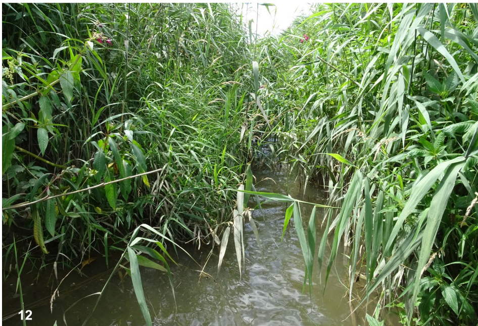
Abb. 11–12: Der künstliche Seitenarm der Aschach: (11) im Jahr 2015 (7.7.2015), (12) im Jahr 2022 (13.7.2022). / The man-made side-arm of the Aschach: (11) in 2015, (12) in 2022.