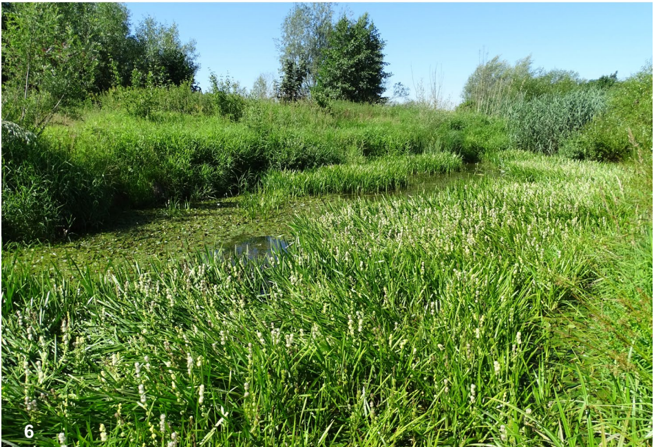
Abb. 5–6: Künstlich angelegtes Nebengewässer des Leitenbaches: (5) im Jahr 2015 (6.7.2015), (6) im Jahr 2022 (26.6.2022). / Man-made backwater of the Leitenbach: (5) in 2015, (6) in 2022.