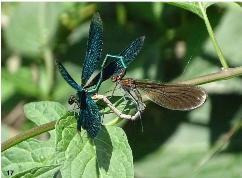
Abb. 16–17: An der Aschach: (16) Männchen von Gomphus pulchellus, 12.6.2022, (17) Paarungsrade von Calopteryx virgo, 16.8.2022. / At the Aschach: (16) male G. pulchellus, (17) copulation “wheel” of C. virgo.