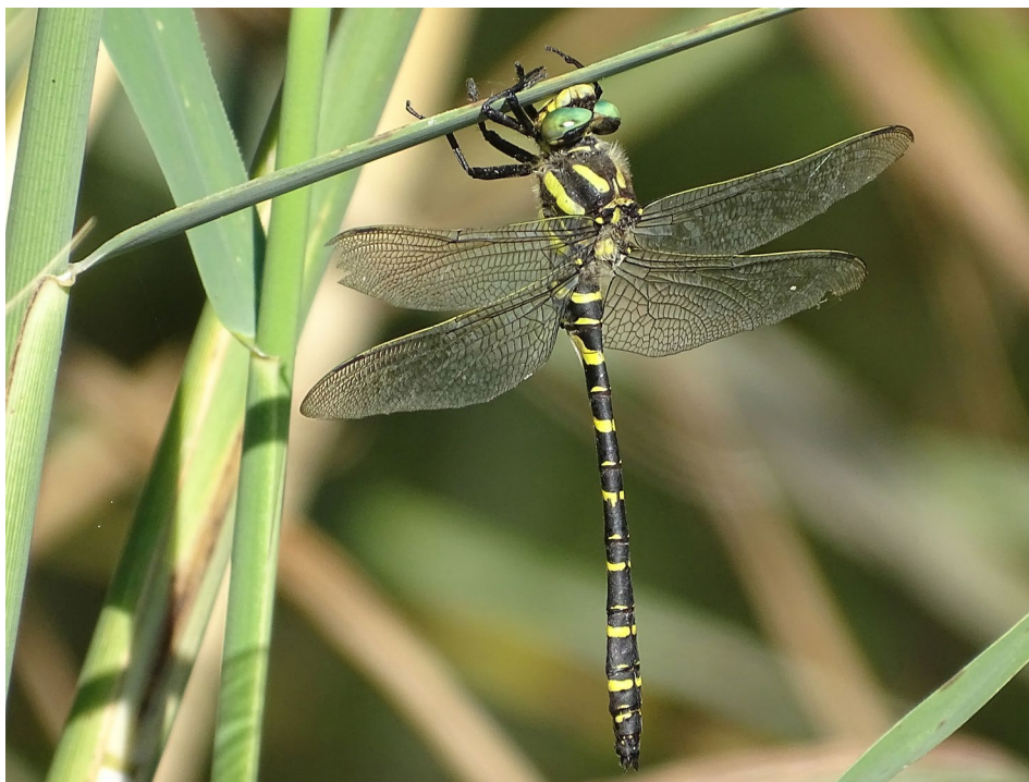
Abb. 13: Männchen von Cordulegaster boltonii beim morgendlichen Aufwärmen am Nebengewässer des Leitenbaches, 17.8.2022. / Male Cordulegaster boltonii warming up at the backwater of the Leitenbach in the morning.

was die Gewässerbreite betrifft – an den Gewässertyp „ÜR HR/EP klein“ grenzen. Der Nachweis des rheobionten Cordulegaster boltonii am Nebengewässer des Leitenbaches betrifft ein Männchen beim morgendlichen Aufwärmen (Abb. 13). Das Individuum verließ das Stillgewässer bald und flog zur Fließstrecke des Leitenbaches.