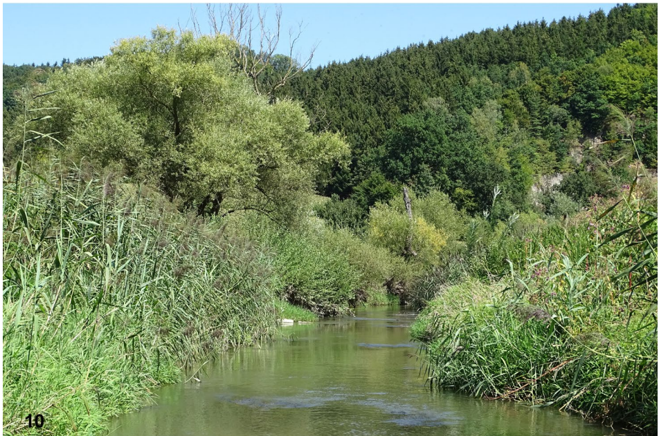
Abb. 9–10: Die Aschach: (9) im Jahr 2015 (4.8.2015), (10) im Jahr 2022 (16.8.2022). / The Aschach: (9) in 2015, (10) in 2022.