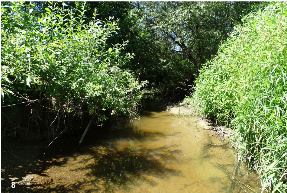
Abb. 7–8: Der Sandbach: (7) im Jahr 2015 (3.8.2015), (8) im Jahr 2022 (26.6.2022). / The Sandbach: (7) in 2015, (8) in 2022.