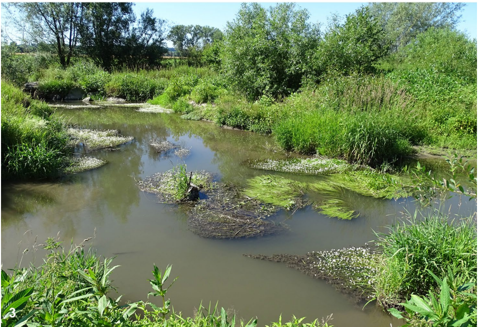
Abb. 2–3: Aufgeweiteter Bereich des Leitenbaches mit geringer Strömungsgeschwindigkeit: (2) im Jahr 2015 (7.7.2015), (3) im Jahr 2022 (26.6.2022). / Widened section of the Leitenbach with low flow velocity: (2) in 2015, (3) in 2022.