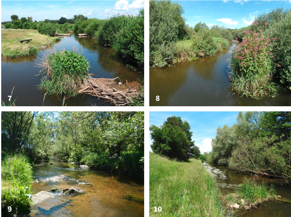
Abb. 7–10: Untersuchungsstrecke: (7–8) Hauswiesen: (7) 27.5.2018, (8) 6.7.2024, (9) Naarn bei der Tobrakanalmündung, 20.5.2024, (10) Haid, 27.5.2018. / Investigated stretch: (7–8) Hauswiesen, (9) Naarn at the mouth of the Tobra-channel, (10) Haid.

100 m lange Nebenarm in diesem Bereich war im Jahr 2018 zweiseitig angebunden und durchflossen, im Jahr 2024 war die oberstromige Anbindung durch Sedimentablagerung unterbunden und der Großteil des Nebengewässers war trocken gefallen und stark verwachsen.