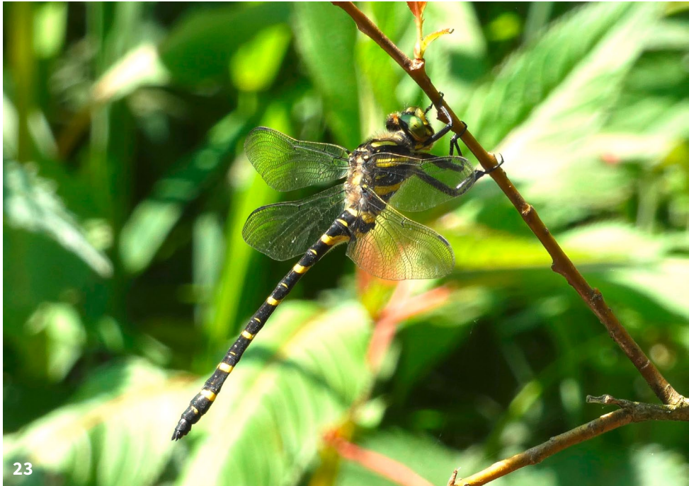
Abb. 22–23: Naarn bei Tobrakanal­mündung: (22) Exuvie von Ophiogomphus cecilia, 8.7.2024, (23) Männchen von Cordulegaster boltonii, 25.6.2024. / Naarn at the mouth of the Tobra-channel: (22) exuvia of Ophiogomphus cecilia, (23) male of Cordulegaster boltonii.