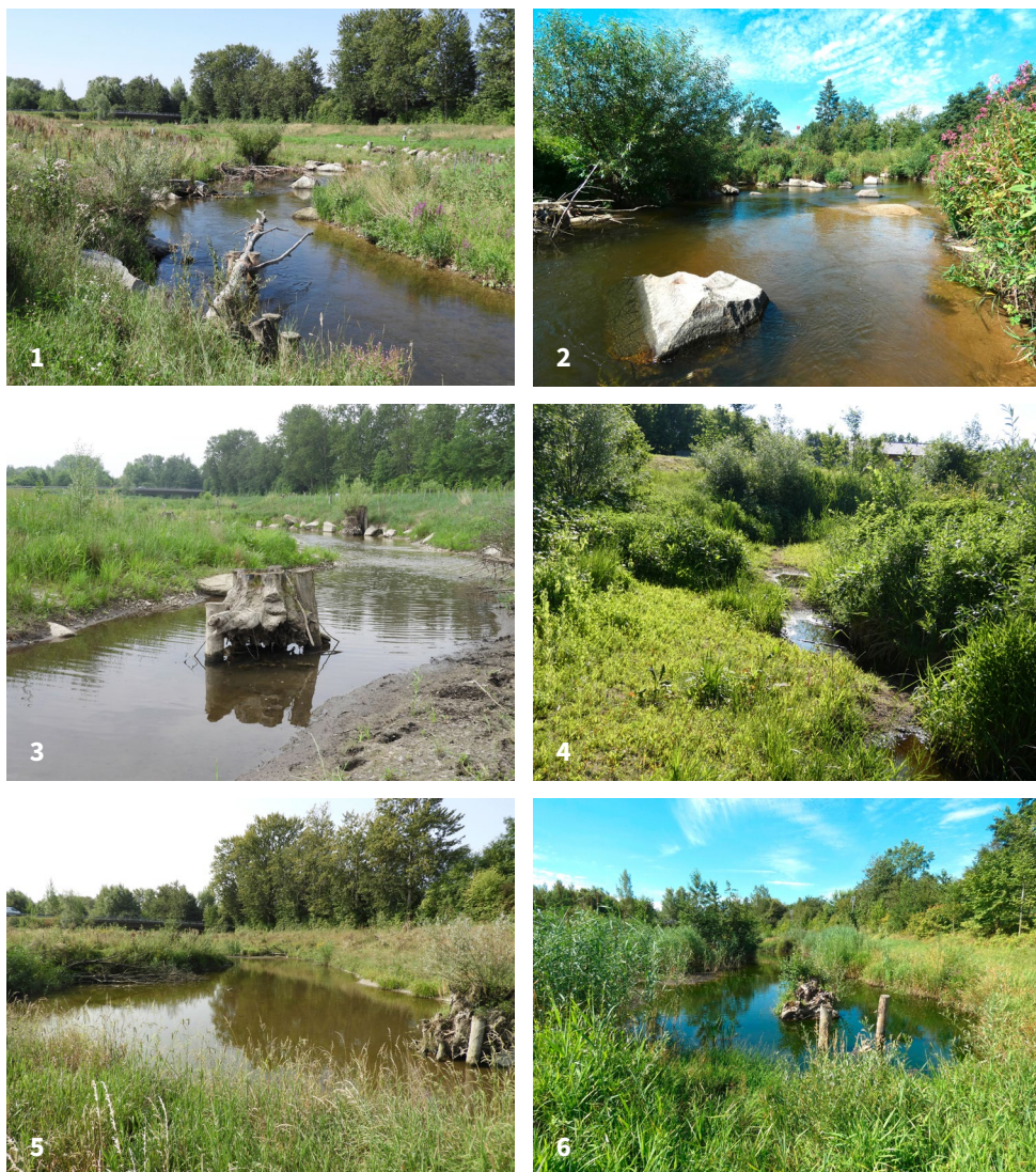
Abb. 1–6: Untersuchungsstrecke Perg/Kickenau: (1) Fluss, 19.7.2018, (2) Fluss, 6.7.2024, (3) Nebenarm, 10.5.2018, (4) Nebenarm, 20.5.2024, (5) Bucht, 29.8.2018, (6) Bucht, 6.7.2024. / Investigated stretch Perg/Kickenau: (1–2) river, (3–4) side arm, (5–6) cove.

mündung (eine Strecke), Labing/Kaindlau (eine Strecke) und Naarn vor der Mündung (eine Strecke). Die Anzahl der in den einzelnen Bereichen untersuchten Strecken spiegelt die Heterogenität der Strukturen wider. Neben dem Fluss selbst und einem Nebenarm wurden im Bereich Perg/Kickenau zwei Buchten kartiert, deren Uferlänge zusammen etwa 100 m ausmachte; da beide Standorte demselben Habitattyp angehören, wurden die dort erhobenen Daten zusammengefasst (Strecke Perg/Kickenau Buchten). Der etwa