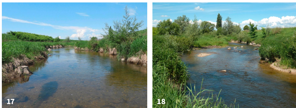
Abb. 17–18: Untersuchungsstrecke Naarn vor der Mündung: (17) 10.5.2018, (18) 20.5.2024. / Investigated stretch Naarn before its mouth.