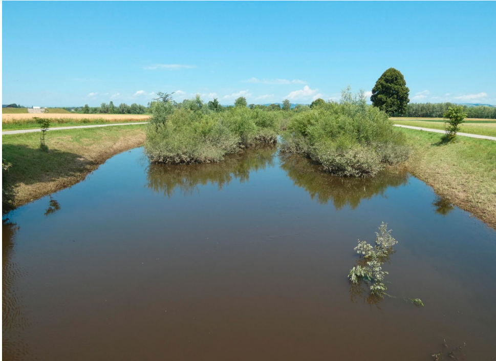
Abb. 19: Untersuchungsstrecke Labing/Kaindlau bei hohem Wasserstand, 8.6.2024. / Investigated stretch Labing/Kaindlau at high water level.