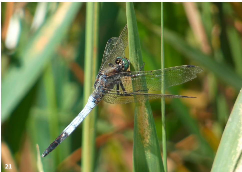
Abb. 20–21: Männchen von: (20) Ophiogomphus cecilia (Naarn bei Tobrakanal­mündung), 19.7.2024, (21) Orthetrum albistylum in einer der beiden Buchten im Bereich Perg/Kickenau, 8.7.2024. / Male of: (20) Ophiogomphus cecilia (Naarn at the mouth of the Tobra-channel), (21) Orthetrum albistylum in one of the two coves in the section Perg/Kickenau.