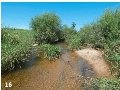
Abb. 11–16: Untersuchungsstrecke Labing/Kaindlau: (11) 27.5.2018, (12) 19.7.2024, (13–14) 29.8.2018, (15–16) 6.7.2024. / Investigated stretch Labing/Kaindlau.

der Restrukturierung errichtete Insel etwa 40 m. Die Strömungsgeschwindigkeiten im Flussgerinne selbst beliefen sich auf wenige cm/s bis maximal etwa 50 cm/s; die höchsten Geschwindigkeiten waren in den Bereichen Labing/Kaindlau sowie Naarn vor der Mündung zu verzeichnen. Das Substrat setzte sich vorwiegend aus unterschiedlichen Kiesfraktionen, Sand und – in strömungsberuhigten Arealen – Detritus zusammen. Die Ufervegetation wurde von Drüsigem Springkraut ( Impatiens glandulifera ), Rohrglanzgras ( Phalaris arundinacea ), und Großer Brennnessel ( Urtica dioica ) dominiert.