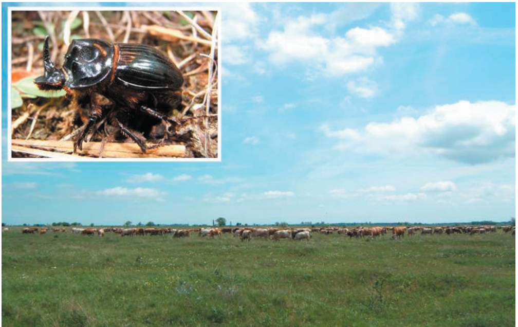
Abb. 2: Die Fleckviehweide an der Langen Lacke. Insert: Copris lunaris ♂ (LINNAEUS, 1758). (Fotos: Strodl M.A., 12. Mai 2007).