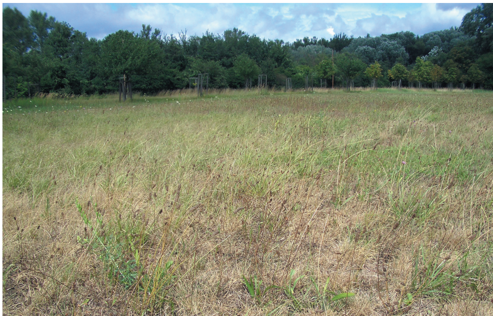
Abb. 1: Halbtrockenrasen in der Unteren Lobau in Wien – Lebensraum von Bolbelasmus unicornis (Foto: Wolfgang Paill, 6.8.2006).