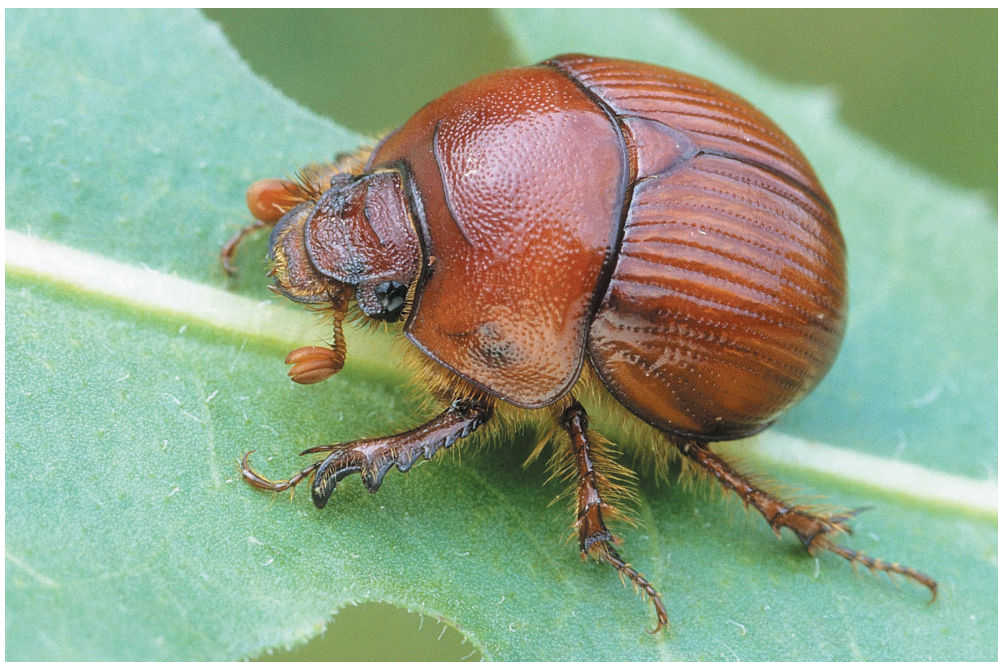
Abb. 2: Bolbelasmus unicornis , Weibchen (Foto: © Petr Zabransky, 8.7.1997)