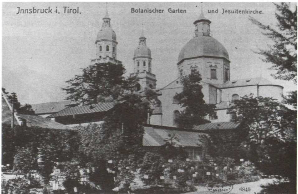
Abb. 1: Der alte Botanische Garten bei der Jesuitenkirche in der Innsbrucker Innenstadt, um 1900; nach einer käuflichen Ansichtskarte (Orig. Stadtarchiv Innsbruck).

Der 1793 am Gelände der heutigen alten Universität gegründete, in der Zeit der Aufhebung der Universität 1809 - 1826 schwer in Mitleidenschaft gezogene Innsbrucker Garten erlebte unter KERNER von 1860 bis zu dessen Berufung nach Wien (1878) die erste