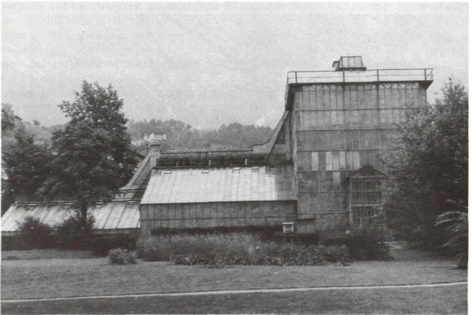
Abb. 4: Die Schauhäuser der Glashausanlage im Botanischen Garten in Hötting aus dem Jahre 1909. (Der 14 m hohe Zentralteil beherbergte Palmen und Riesenbambus, vor dem kleinen Sukkulentenhaus links ein mächtiger baumförmiger Sanddorn, der dem Neubau 1977 weichen mußte.)