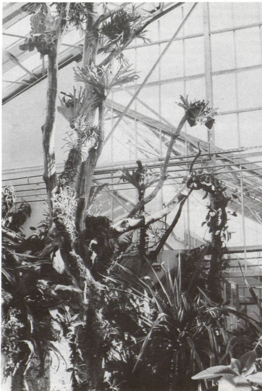
Abb. 6: Ein Epiphytenstamm im Tropenhaus, bepflanzt mit Bromelien, Vanille, Pfeffergewächsen und Geweihfarnen.