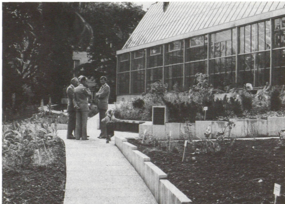
Abb. 7: Die neueröffnete Heil-Gift- und Gewürzpflanzenanlage an der Südseite des Gewächshauses.