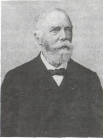
Abb. 2: Anton KERNER von Marilaun, geb. 1831 in Mautern an der Donau, von 1860 bis 1878 als Nachfolger Adolf PICH- LERs Professor der Naturgeschichte, dann der Botanik in Innsbruck, gestorben 1898 als Professor der Botanik in Wien; einer der Begründer der ostalpinen Pflanzen- geographie und Vegetationskunde.

insbesondere die Anlage der bereits erwähnten biologischen Gruppen (Gruppierung von Pflan- zen nach morphologischen, blütenbiologischen oder verbreitungsökologischen Kriterien) fand Nachahmung, z.B. in Zürich, Berlin, Prag und Mün- chen. In den Jahren 1909 - 1910 übersiedelte der Botanische Garten aus dem nicht mehr erweite- rungsfähigen Areal an der alten Universität nach seinem derzeitigen Standort in Hötting, wo 1913 auch das neue Botanische Institut feierlich eröff- net wurde. Die Konzeption der gesamten Garten- anlage diente auch am neuen Areal den Erforder- nissen der Lehre und Forschung im damals übli- chen Ausstattungsschema der meisten Botani- schen Gärten: System, Arboretum, Alpinum, Gewächshäuser bildeten die Hauptelemente der neuen Gartenanlage (1979 konnte die aus dem Jahre 1909 stammende Gewächshausanlage durch einen Neubau an Ort und Stelle ersetzt werden).