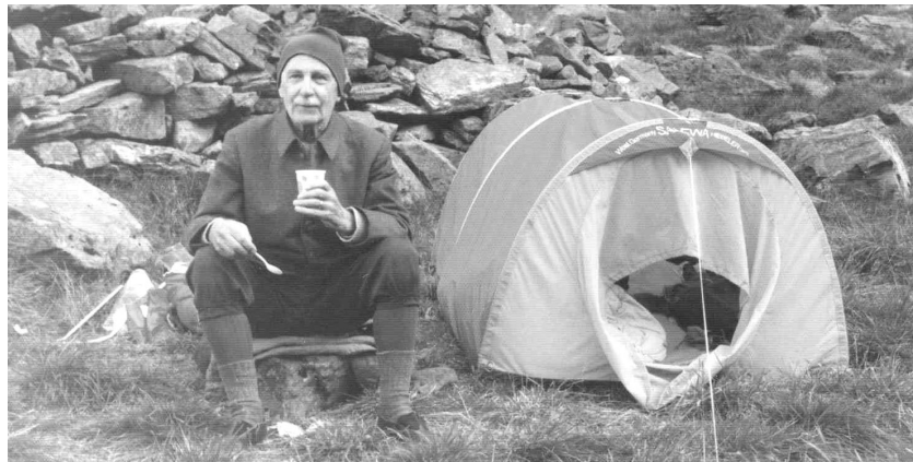
Beim Blockgletscher am Breitlehnjöchl (Geigenkamm - Öztaler Alpen).