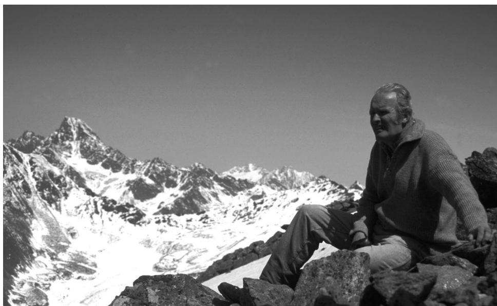
Foto 2: Auf dem Schafkopf (3000 m) bei Nauders (im Hintergrund der Glockturm), Ötztaler Alpen, am 21.6.1998.

Die Lehrveranstaltung „Ökologische Feldmethoden“ sind aus bescheidenen Anfängen durch seine und seiner Mitarbeiter Intensionen zu einem ansprechenden Angebot für Studierende der Zoologie in Innsbruck geworden. Das „Arthropoden-Seminar“ hat ihn zum Initiator, noch im Dissertantenraum des zweiten Stockes der Alten Universität. Die von ihm angebotenen Lehrveranstaltungen im Grund- und Hauptstudium zeigen sein Interesse im forschenden Lehren und hatten ihren Schwerpunkt in der Systematik, Taxonomie, Phylogenie und Ökologie der Arthropoden unter Berücksichtigung von Bauplänen, Lebensweise