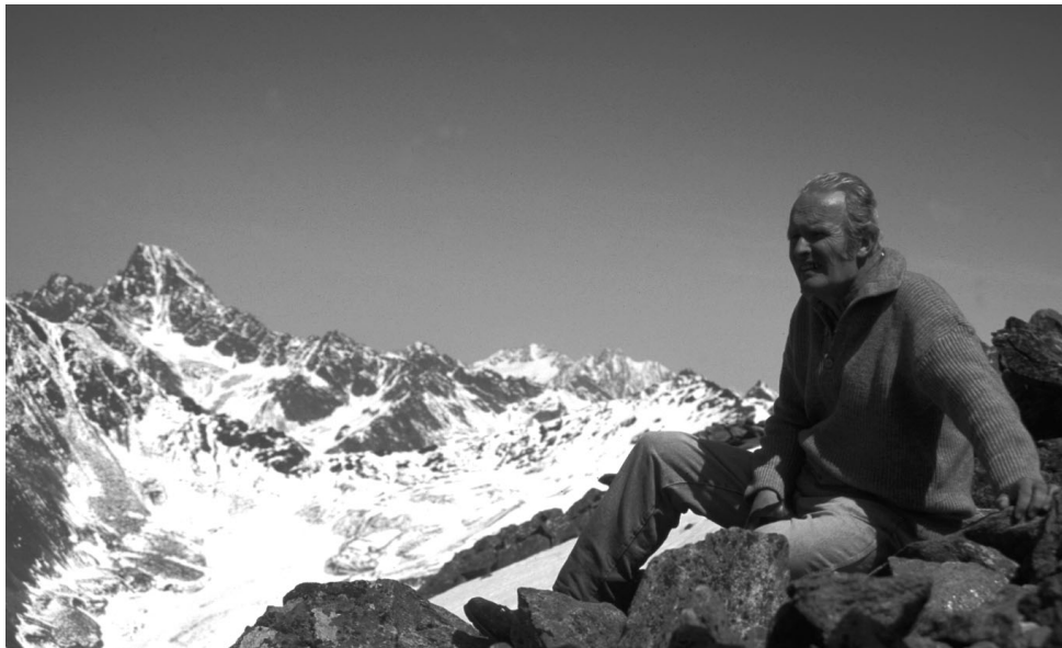
Foto 2: Auf dem Schafkopf (3000 m) bei Nauders (im Hintergrund der Glockturm), Ötztaler Alpen, am 21.6.1998.

Die Lehrveranstaltung „Ökologische Feldmethoden“ sind aus bescheidenen Anfängen durch seine und seiner Mitarbeiter Intensionen zu einem ansprechenden Angebot für Studierende der Zoologie in Innsbruck geworden. Das „Arthropoden-Seminar“ hat ihn zum Initiator, noch im Dissertantenraum des zweiten Stockes der Alten Universität. Die von ihm angebotenen Lehrveranstaltungen im Grund- und Hauptstudium zeigen sein Interesse im forschenden Lehren und hatten ihren Schwerpunkt in der Systematik, Taxonomie, Phylogenie und Ökologie der Arthropoden unter Berücksichtigung von Bauplänen, Lebensweise