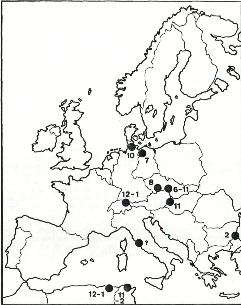
Abb.3 BEOBACHTUNGEN VON IM SEEWINKEL MIT HALSMANSCHETTEN BERINGTEN GRAUGÄNSEN (A.ANSER). DIE ZAHLEN GEBEN DIE MONATE AN.