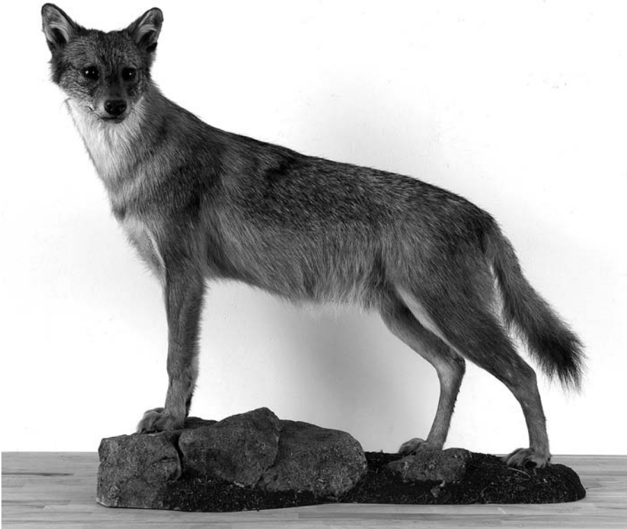
Abb. 3: Das Präparat des am 12. September 2005 in St. Florian am Inn, südöstlich von Roßbach, überfahrenen subadulten Goldschakals (♂). Präpariert wurde das Tier von Dieter Schön, Pfarrkirchen im Mühlkreis.

das Gesamtskelett befinden sich in der Sammlung des Biologiezentrums der Oberösterreichischen Landesmuseen, Linz. Inv.-Nr.: 2006/490. Insgesamt sind damit 17 Nachweise des Goldschakals in Österreich bekannt, wovon 15 Tiere belegt sind.