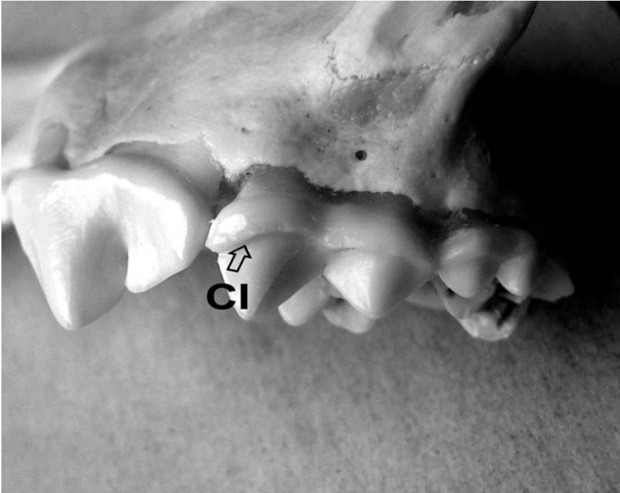
Abb. 2: Schädelfragment des am 23. März 2006 auf der Autobahn 2, Höhe Scheiblingkirchen, überfahrenen Goldschakals (♀). Das beste Einzelmerkmal, vor allem bei unvollständigen Cranaea, ist das sehr markant ausgebildete buccale Cingulum 1 (CI) von M 1-2 im Oberkiefer, das bei Wolf und Hund fehlt oder kaum angedeutet ist (beim Fuchs allerdings ebenfalls vorkommt!) (BAUER 2001b, DEMETER & SPASSOV 1993).