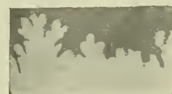
Fig. 3. Yezoites Perrini And.

weitig gegeben worden. Nach ihr können die Arten mit weitgenabelten Spiralwindungen wie Scaphites auritus Schl. 2) darin keinen Platz finden. Außerdem ist nach Zittel die »Mündung etwas eingeschnürt«; die oben genannte Art aber zeigt am Mundrand nicht nur eine Einschnürung, sondern auch wohlausgebildete Seitenohren. Hyatts letzte Auffassung ist auch nicht viel besser. 3) Er gibt eigentlich nicht die Gattungsdiagnose der Scaphiten sondern hat die Familie der Scaphitidae , welche nach ihm Scaphites , Discoscaphites , Anascaphites und Jahnnites enthält, folgendermaßen gefaßt: