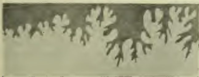
Fig. 1. Scaphites aequalis d'Orb.

Die gebräuchliche Diagnose dieser Gattung betrifft hauptsächlich die Gestalt der losgelösten Wohnkammer und ist recht unvollkommen; diejenige von Zittel in den »Grundzügen« ist zum Teil schon ander-