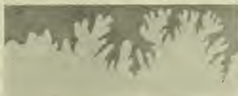
Fig. 2. Scaphites constrictus d'Orb.