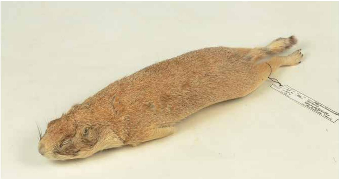
Abb. 1: Der Balg des Schwarzschwanz-Präriehundes Cynomys ludovicianus in der Sammlung des Biologiezentrums, Inv.-Nr.: 2004/44.