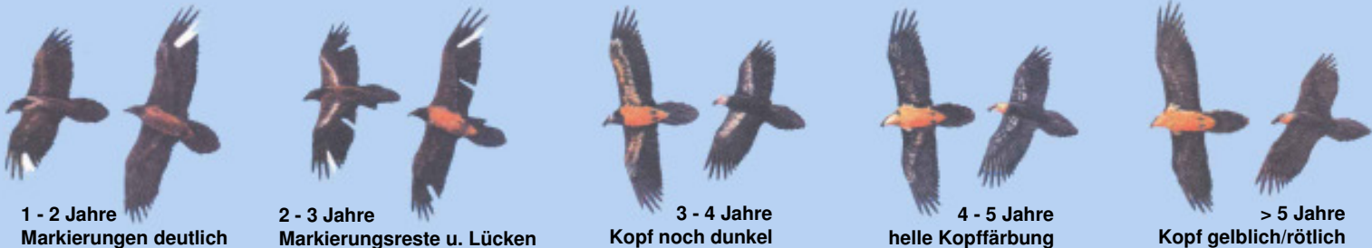
1 - 2 Jahre Markierungen deutlich

Grafiken: El Quebrantahuesos en los Pireneos (R. Heredia y B. Heredia); Ministerio de Agricultura Pesca y Alimentación. Publicaciones del Instituto Nacional para la Conservación de la Naturaleza, 1991