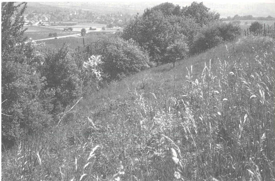
Abb. 2. Hecken, das «klassische» Naturschutz-Objekt, gibt es in Mitteleuropa nicht «von Natur aus»: Künstlich angelegt, dienten sie früher der Abgrenzung, der Einzäunung und dem Windschutz. Hecken wurden zudem vielfältig genutzt: Laubheu, Laubstreu, Beeren, Nüsse, Brennholz. Heute erfüllen sie wichtige natur- und landschaftsschützerische Funktionen: Lebens- und Rückzugsraum, Verbreitungsachsen (Biotopverbund), Landschaftsgliederung.

Magerwiesen (Vordergrund) mit ihrem hohen Artenreichtum sind – mit wenigen Ausnahmen – ebenso wenig ein «Naturprodukt»: Sie entstanden erst nach vorgängiger Waldrodung und bedürfen einer regelmäßigen, extensiven landwirtschaftlichen Nutzung (Schnitt). Nach Aufgabe der Bewirtschaftung erfolgt Verbrachung und Wiederbewaldung.