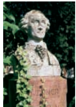
Denkmal Werner de Lachenal