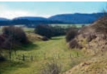
Combe Vatelín (Fev. 1997)

Autrefois, la Combe Vatelín faisait partie des terres pauvres et éloignées du village de Courgenay. Les parties planes et les crêts de la combe étaient alors utilisés par une agriculture extensive. Durant les 20 à 30 années passées, la manière dont étaient utilisées les terres a considérablement modifié et appauvri la flore et la faune de la Combe. Ce qui dominait il y a