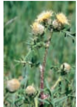
Cirsium kosmelii (Adams) Fisch. ex Hohen.