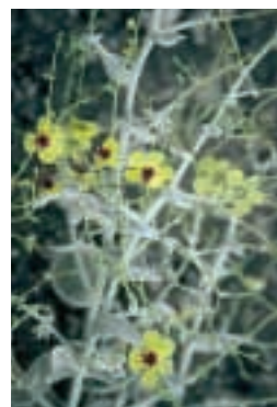
Verbascum isauricum Boiss. & Heldr.