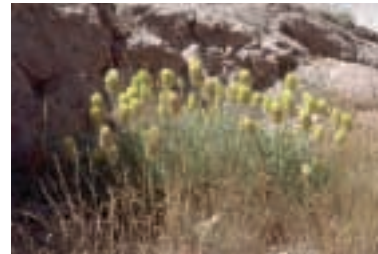
Astragalus lagurus Willd.