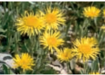
Inula montbretiana DC.