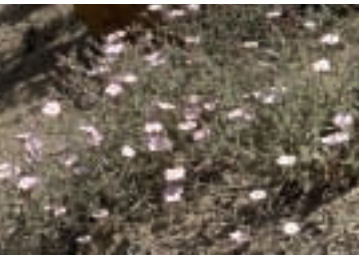
Convolvulus cantabrica L.