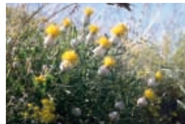
Centaurea saligna (C. Koch) Wagenitz