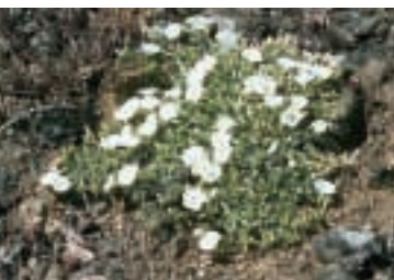
Convolvulus phrygius Bornm.