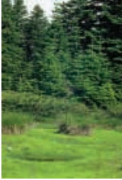
Isoetes olympica A. Braun: Locus classicus