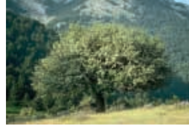
Crataegus orientalis Pallas var. orientalis : Gesamtansicht