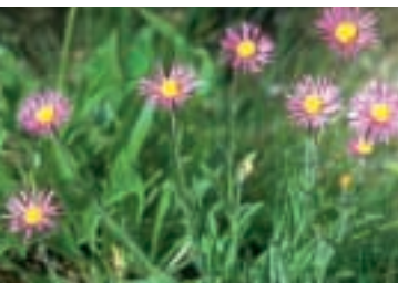
Erigeron caucasicus Stev. ssp. venustus (Botsch.) Grierson