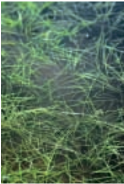
I. olympica im Tümpel

Hotel und Camping, 1650 m, 1. 8. 1976, Ny. 11519, 4. Fund. A2(A) Bursa: nr: Uludağ, Hochmoor in Abies bornmuelleri -Wald zwischen Hotel und Camping, 1650 m, 6. 7. 1979, Ny. 14043, 5. Fund. Davis 1/37: «In Turkey only known from the locus classicus.» Der Standort ist sehr ge- fährdet einerseits durch den Campingbetrieb, andererseits die Wildschwei- ne, die diese Pflanzen ausgraben.