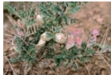
Astragalus russelii Banks & Sol.