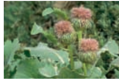
Serratula serratuloides (DC.) Takht.