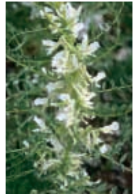
Astragalus neurocarpus Boiss.