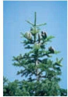
Abies nordmanniana (Stev.) Spach