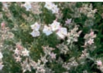
Convolvulus oleifolius Desr. in Lam.