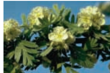
C. orientalis : Ast mit Blüten