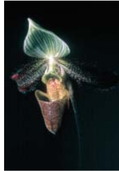
Abb. 3: Paphiopedilum wardii

raschende Erkenntnisse. Dies soll im Folgenden mit einigen neueren Ergebnisse aus den Bereichen Bestäubungsbiologie und Systematik kurz erläutert werden: