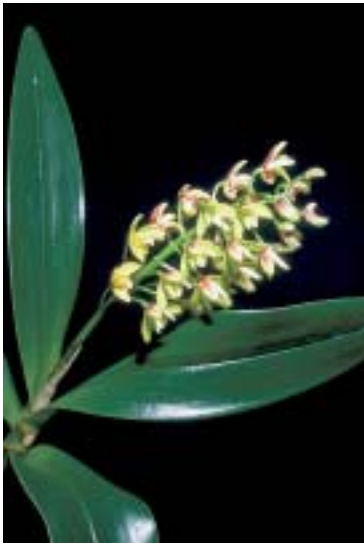
Abb. 12a: Dendrobium gracicaule