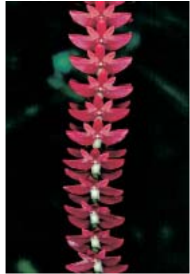
Abb. 11: Dendrochilum wenzelii

publiziert (PEDERSEN et al. 1997, PEDERSEN 1993). Die Gattung Bulbophyllum ist noch weit von einer umfassenden Revision entfernt, hauptsächlich weil die Gattung so gross und unübersichtlich ist. Jährlich werden viele neue Arten beschrieben. Es gibt kaum eine Expedition nach Südostasien, bei der nicht neue Bulbophyllum -Arten beschrieben werden (VERMEULEN 1996a, VERMEULEN 1996b, VERMEULEN & OBYRNE 1993).