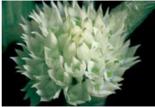
Abb. 4: Dendrobium capituliflorum