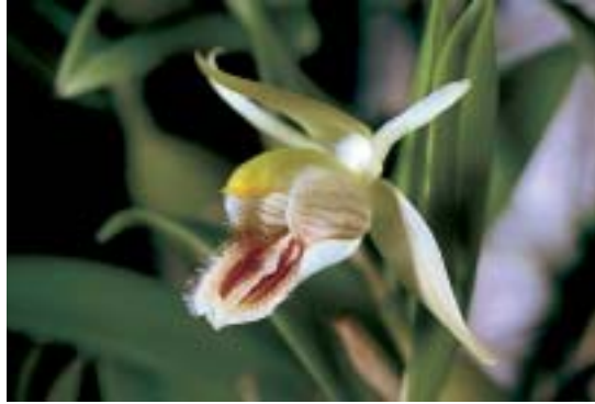
Abb. 10: Coelogyne fimbriata