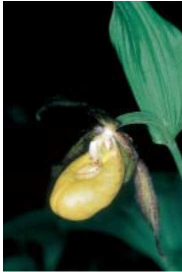
Abb. 2: Cypripedium calceolus