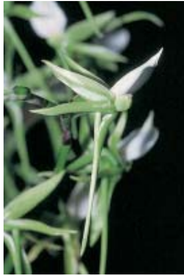
Abb. 7: Angraecum eburneum ist ein Vertreter der madagassischen Orchideen mit einem langen Sporn.