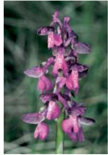
Abb. 8: Orchis morio wird in Zukunft Anacamptis morio heissen.

sondern Anacamptis morio heissen, weil es in einer Gruppe steht, die Anacamptis pyramidalis enthält (BATEMAN et al. 1997, PRIDGEON et al. 1997). Kürzlich wurde auch die Unterfamilie der Frauenschuhorchideen mit Hilfe von nukleärer DNA untersucht. Dabei konnten nicht nur die phylogenetischen Verhältnisse geklärt werden, sondern auch Aussagen über das mögliche Ursprungsgebiet dieser Gruppe gemacht werden (Cox et al. 1997). Die Autoren vermuten, dass die ganze Unterfamilie im nord- bis mesoamerikanischen Raum entstanden ist. Um Material für solch wichtige und aufwendige Untersuchungen zu erhalten, sind die Sammlungen der Botanischen Gärten unerlässlich, denn von vielen Arten sind die Fundorte zerstört, heute nicht mehr zugänglich oder können nicht rechtzeitig beschafft werden.