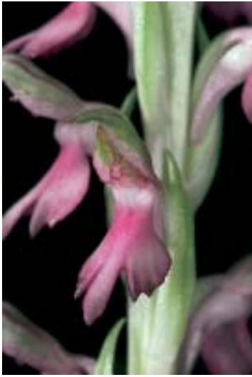
Abb. 6: Anteriorchis sancta ist im östlichen Mittelmeergebiet zu finden.