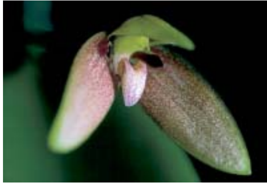
Abb. 12b: Bulbophyllum christophersenii

es eine umfangreichere Sammlung dieser Orchideen (Abb. 12). Denn nach wie vor geht die Zerstörung der Wälder in Neukaledonien ungehindert weiter. Um das Risiko eines Verlustes von solch wertvollen Pflanzen zu vermindern, wurden viele Pflanzen geteilt und an andere Botanische Gärten vergeben.