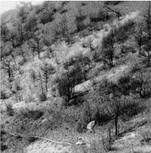
Abb. 1: Aufnahme vom März 1998 des Versuchshanges am Monte Barro. Die hellere Fläche zeigt den Bestand an Molinia arundinacea . Quercus pubescens kommt in lockerem Bestand vor.

Im Juni 1998 suchten wir die markierten Pflanzen wieder und fanden alle 12 freigestellten Individuen sowie 9 Kontrollpflanzen. Drei Kontrollindividuen, die nur mit dem Plastikring