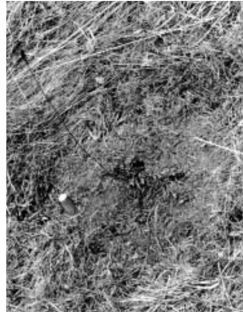
Abb. 2: Aufnahme vom März 1998. Letztjähriger, markierter Fruchtstand von Stachys alopecuroides . Die Vegetation im Umkreis von ungefähr 20 cm wurde entfernt.