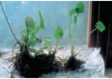
Abb. 4: Zwei ausgegrabene Individuen von Stachys alopecuros . Rechts im Bild die Kontrollpflanze mit deutlich längeren Blattstielen. Links die freigestellte Pflanze mit kürzeren Blattstielen und vegetativen Ausläufern.

Blattwachstum. Allerdings sind Schattenblätter im allgemeinen grösser als Sonnenblätter, da die Vergrößerung der Blattfläche auch einen erhöhten Lichteintrag bedeutet. Wenn wir die Gesamtfläche der photosynthetisierenden Organe (Blattlänge \times Blattbreite \times Anzahl Blätter, Mittelwerte aus Tab. 1) als Mass für die potentielle Produktivität betrachten, kann zusammenfassend folgendes festgestellt werden: Die durchschnittliche Blattfläche eines Blattes der freigestellten Individuen war mit 17.1 \text{ cm}^2 um einiges kleiner als diejenige der Kontrollindividuen ( 26.5 \text{ cm}^2 ). Trotzdem machte die grössere Anzahl Ausläufer und Anzahl Blätter pro Ausläufer diesen Unterschied mehr als wett, denn die durchschnittliche Blattfläche der freigestellten Individuen betrug 530.4 \text{ cm}^2 gegenüber 408.6 \text{ cm}^2 für Kontrollindividuen.