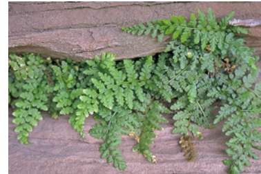
Fig. 1: Asplenium obovatum subsp. lanceolatum .

Sur grès vosgien, environs de Saverne (Bas-Rhin), juillet 1999