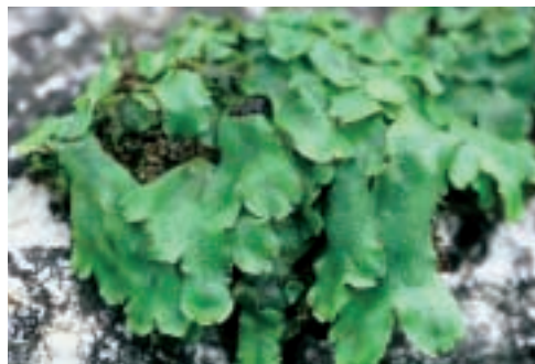
Abb. 4: Conocephalum conicum , dominierend auf dem Boden der Doline