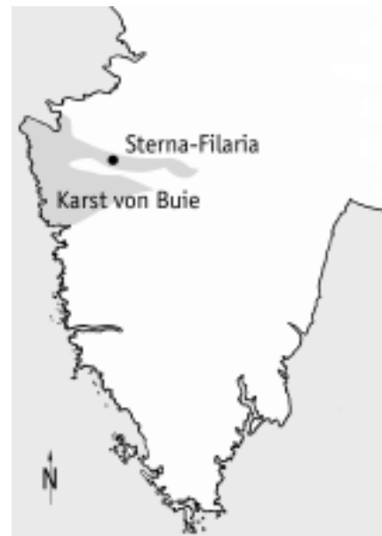
Abb. 1: Lage des Karstgebietes von Buje/Buie auf der Halbinsel Istrien