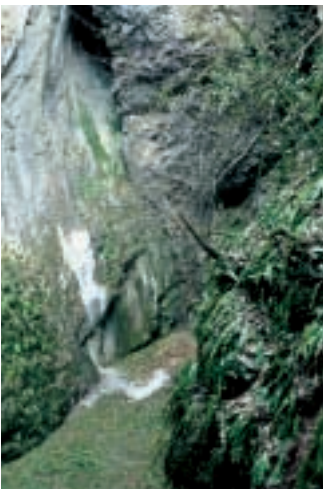
Abb. 3: Der Grund der Doline mit der Basis der nördlichen Felswand (Schneereste am 15. Mai 2000!)

Zusammenfassend kann man feststellen, dass die Moosflora der Doline Sterna-Filaria auch in tieferen Lagen keine spezifisch alpinen Arten aufweist, dagegen vermehrt mitteleuropäische hygrophile Formen, die unter den besonderen lokalklimatischen Bedingungen am Rand des Mittelmeergebiets vorkommen können. Verglichen mit den Angaben von BECK v. MANNAGETTA (1906) aus den Dolinen des Trnowaner Waldes mit grösseren floristischen Unterschieden in verschiedenen Tiefen ist festzuhalten, dass in diesem nördlicher gelegenen Gebiet die Karstoberfläche gegen 1000 m höher liegt als in der untersuchten Gegend in Istrien und dass damit alpine bzw. subalpine Arten sich dort eher ansiedeln konnten.