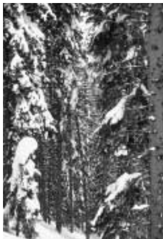
Abb. 3, rechts: Junge Fichte mit Befall durch den Schwarzen Schneeschnitz Herpotrichia juniperi . Das Pilzmyzel entwickelt sich unter der Schneedecke, überwächst die Nadeln zunächst epiphytisch, wird dann durch Bildung von Haustorien ektoparasitisch und dringt schliesslich ins Nadelinnere vor.

Abb. 2, links: Schneebeladene Fichte im Lusiwald. Bei Lufttemperaturen über -3 °C bleibt besonders viel des niederfallenden Schnees auf den Ästen und Baumwipfeln haften.