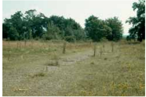
Abb. 5: Ehemaliges Militärgelände nördlich von Neuf-Brisach mit Schotterpisten, 27. 7. 2001. Potentilla alsatica wächst auf ehemaligen Fahrwegen.