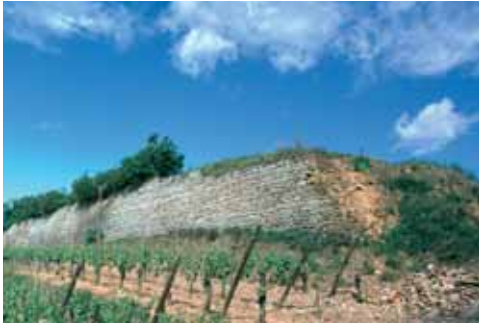
Abb. 4: Fundort von Potentilla alsatica auf dem Letzenberg, 14. 5. 2002. Der kleine Bestand befindet sich auf dem rechten Randbereich der Mauer.