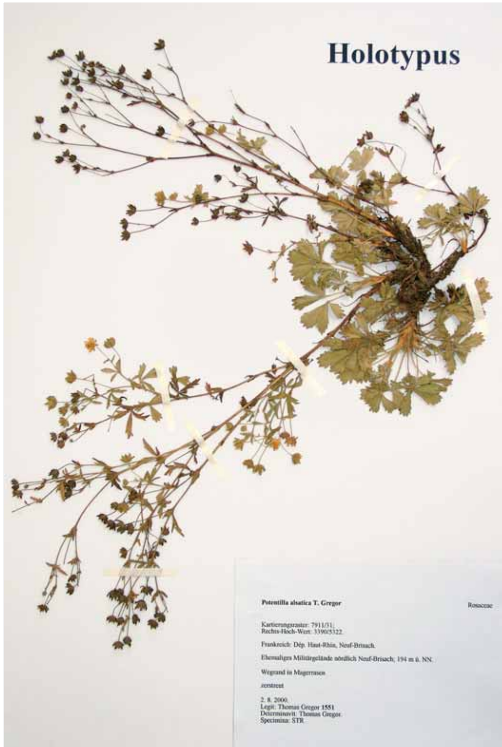
Abb. 1: Holotypus von Potentilla alsatica T. Gregor