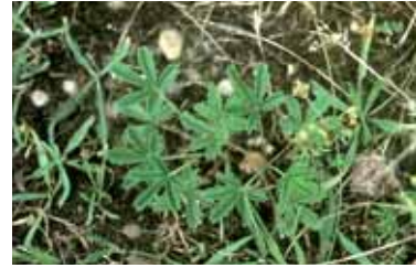
Abb. 2: Grundblattrosette von Potentilla alsatica . Neuf-Brisach, 27. 7. 2001.

Caudex multiceps , tempore florendi surculis brevibus sterilibus. Folia radicalia et caulina inferna mediaque 5(–7)-nata, concava, apice rubro, margo in plantas vivas incrassatus in plantas exsiccatas revolutus, supra modice pilis rectis 0,4–0,8 mm longis, subtus ± virescentes ad nervos pilis rectis usque 1,3 mm longis inter nervos modice pilis crispis; petioli plerumque 3–5 cm longi, modice pilis curtis flexuosis et usque 1,8 mm longis rectis; folioli terminales concavi, anguste obovati, plerumque 2–2,5(–3) cm longi, a medio incisii-serrati dentibus utrinque (3–)4–5, dente terminali vulgo non exserto. Stipulae infimae auriculis linearibus et profunde pilis longis rectis, stipulae caulinae auriculis obliquis ovatis acutis. Folia caulina supera 3-nata foliolo terminali antice manifeste lato dentibus plerumque 3. Caules ascendentes multiflori (saepe > 50) plerumque a inferno parte ramosi pilis curtis flexuosis et longis ± rectis. Flores circa 10 mm diametro, pedunculis 10–15 mm longis saepe curvatis pilis flexuosis et percurtis