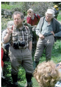
Exkursion mit der BBG, bei Bodma ob Mund im Wallis, 1991