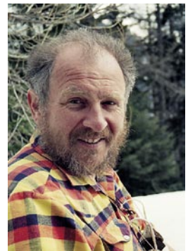
Auf der Suche nach Birkwild im Binntal, 1999