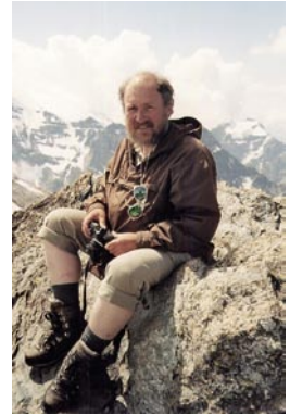
Rundsicht auf die Binner Alpen, Schwarzthorngipfel, 1997