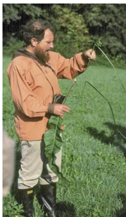
Carex-Demonstration im Sundgau, 1990