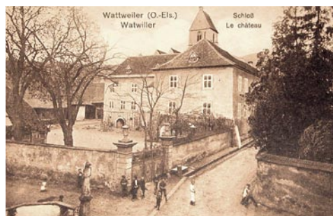
Fig. 8: Le Château de Wattwiller avant sa destruction durant la guerre 1914–1918

à Belgrade. Son cultivar le plus répandu est le «Shipova», originaire d'ex-Yougoslavie. Sorbopyrus est planté dans un grand nombre d'arboretum et de jardins botaniques, essentiellement en Europe centrale, mais n'est que rarement cultivé pour ses fruits. On le trouve par exemple dans le Jardin Botanique de Pruhonice (République Tchèque), dans le «Freiland-Laubgehölze» du Jardin Botanique de Recherche de Günterstal près de Freiburg i. Br. (Allemagne), dans le Jardin Botanique d'Osnabrück (Allemagne), dans le Jardin Botanique de l'Université de Wageningen (Pays-Bas), dans l'Arboretum «Borova hora» de Slovénie et dans le parc de l'Université d'Oxford (Angleterre).