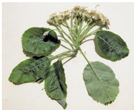
Fig. 3: Inflorescence de Sorbopyrus auricularis (M. Hoff 8207)