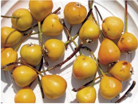
Fig. 4: Les «poires de Bollwiller», fruits du Sorbopyrus auricularis