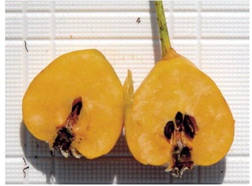
Fig. 5: Coupe du fruit

jaune-orangé, douce et sucrée, peu parfumée, à odeur douceâtre et à consistance de pomme farineuse (parfois à saveur de coing), pépins non fertiles. Fleur: avril à mai; fruit: mi-août à octobre.