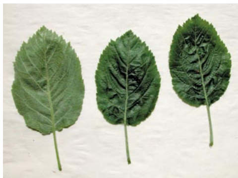
Fig. 2: Feuilles de Sorbopyrus auricularis (M. Hoff 8207)