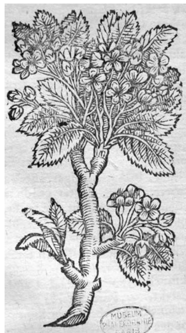
Fig. 1: Gravure de Pirus polvilleriana J. Bauhin, 1650

Ouvrage du Laboratoire de Phanérogamie du Muséum national d'Histoire naturelle, Paris