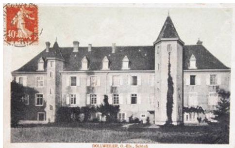
Fig. 7: Le Château Rosen de Bollwiller au début du 20 ème siècle