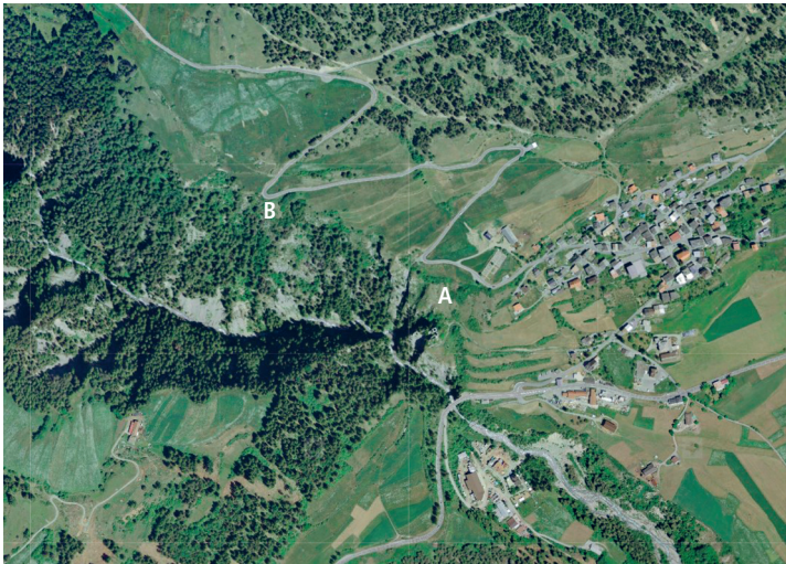
Abb. 2: Die untersuchten Kugelginster-Beständen A und B am Ausgang des Val Sinestra.

Im Vergleich dazu erreicht der Deckungsgrad von Genista radiata im Bestand B teilweise 90 %; entsprechend niedriger ist die Gesamtartenzahl mit 4 bis 13 Arten und der Anteil der Trockenrasenelemente. Brachypodium pinnatum ist hier die häufigste Begleitart (Abb. 3).