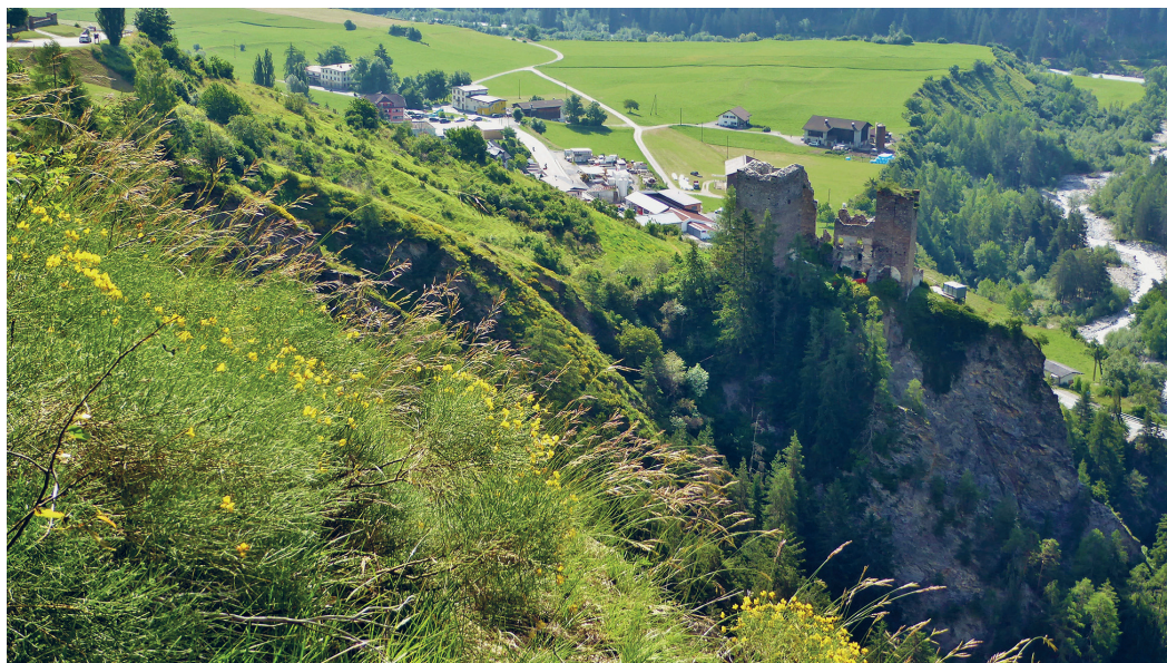
Abb. 3: Genista radiata -Bestand (gemeinsam mit Brachypodium pinnatum ) oberhalb der Burg-ruine Tschaniuff. Foto T. Peer, Juli 2016