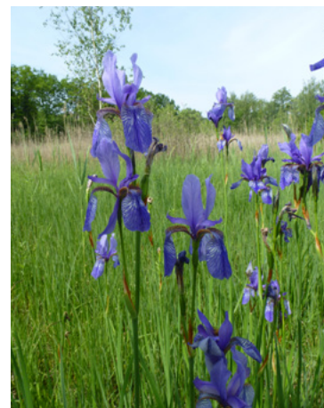
Abb.2: Iris sibirica am Kirchener Kopf, 27. 5. 2016