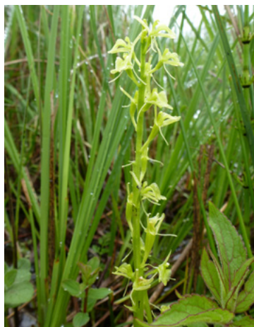
Abb. 5: Liparis loeselii in der Petite Camargue Alsacienne, 9. 6. 2016