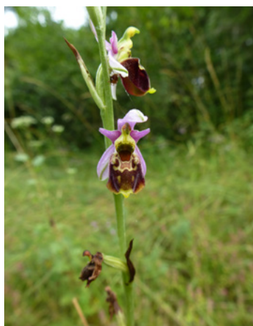
Abb. 6: Ophrys fuciflora subsp. elatior am Kirchener Kopf, 2. 8. 2016