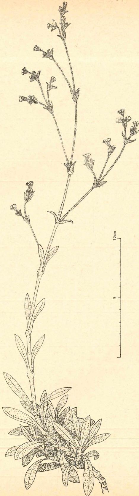
Gypsophila oblancolata Barkoudah