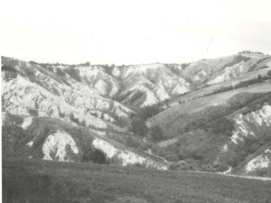
Abb. 2. Calanco bei Castrocaro. Auf den kahlen Hängen das Agropyro-Artemisietum cretaceae , dazwischen Rasenflecken. Am Horizont und gegen den Calanco herabziehend Spartium -Gebüsch, im Hintergrund des Tälchens in der Bildmitte Tamarix -Gebüsch.