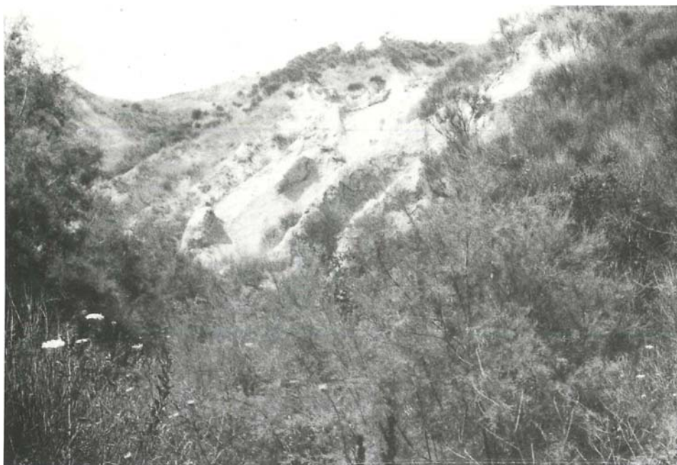
Abb. 4. Calanco bei Castrocaro. Im Vordergrund Tamarisken, rechts oben sowie auf dem Hügel Spartium -Gebüsch. In der Bildmitte fast vegetationsfreie Partien und Rasen.

Böden an pflanzenverfügbarem Wasser insbesondere im niederschlagsarmen Sommer äusserst gering ist, herrschen zeitweise extreme Ariditätsverhältnisse. Die Salzkonzentration der Bodenlösung erreicht Werte, bei denen empfindliche Pflanzen geschädigt werden können.