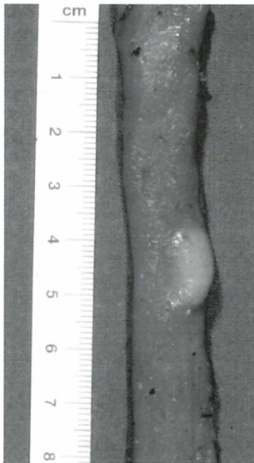
Abb. 2 (rechts) Histologischer Schnitt durch die Peripherie der Sarkosporidien-Makrozyste des Mufflons mit unzähligen Zystozoitien; HE-Färbung